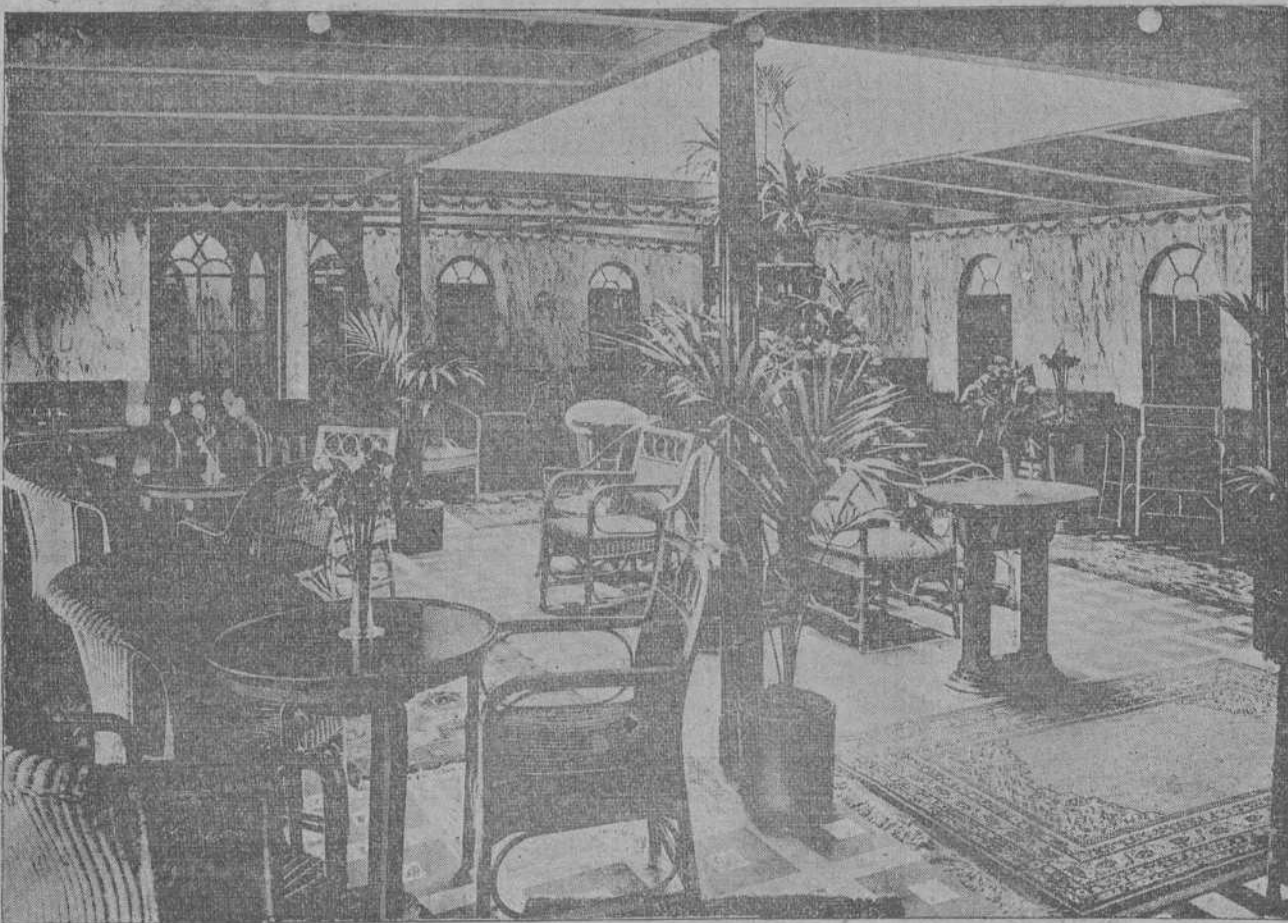
UN INTERIOR DEL TRASATLANTICO «TOLEDO».

Esta noche, a las siete y cuarto, en el salón de la Residencia de Padres Jesuitas, dará el Padre Jambrina una conferencia apologética, sobre el tema interesantísimo y capital de la «Verdad histórica de los milagros de Jesucristo», o, en otros términos, «Los milagros de Jesucristo ante la crítica moderna».