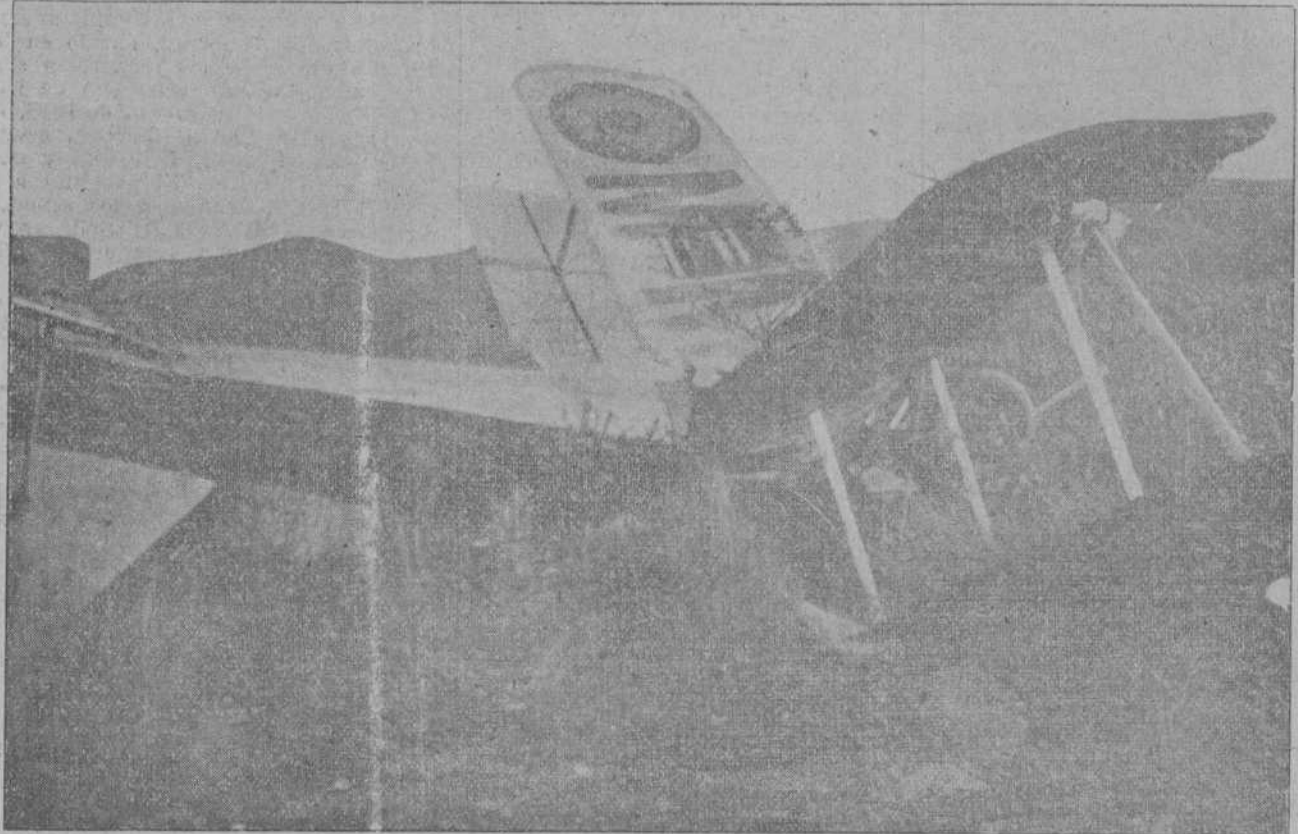
MARRUECOS.—El aparato 'Ereget' (Madrid) que tomó árboles en vez de tierra en un vuelo verificado el día 13, y que resultó con imor antes averías.

La entrada será pública y gratuita. asistir señoras.