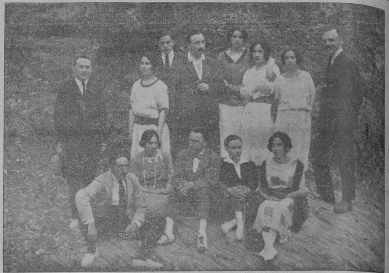
POTES.—Grupos de distinguidos aficionados que en una velada teatral, celebrada durante las fiestas últimas, pusieron en escena la obra «No te ofendas, Beatriz», obteniendo un clamoroso éxito.

Fuí perdiendo velocidad hasta que me quedé inmóvil, como si hubiera llegado a ocupar una densidad proporcional a mi peso, pero mi cabeza seguía en descenso, anclándose en el cuerno—tré mi vista al nivel de los hombros y una luz vivísima empezó a cejar mis ojos me pugnaban por abrirse desmesuradamente ante el vacío, librando rociocombate en las tinieblas con el rayo de luz que me mostraban las puertas de la vida, de donde salí estúpidamente con la insensata idea de explorar los parajes vedados a la in-