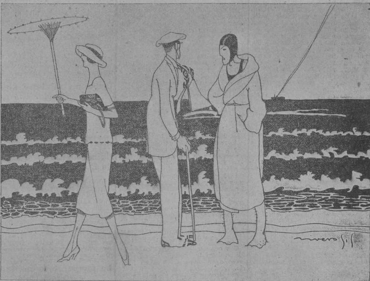
EL OBSERVADOR.—¡Qué mono tipo!... EL BALANDROFILO (en lo suyo).—Te equivocas. Es un siete metros colosal.