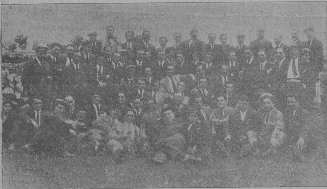
GRUPO DE MECANICOS ASISTENTES AL BANQUETE CELEBRADO EN LUNES EN «LA VIZCAINA» PARA CELEBRAR LA FESTIVIDAD DE SAN CRISTOBAL.