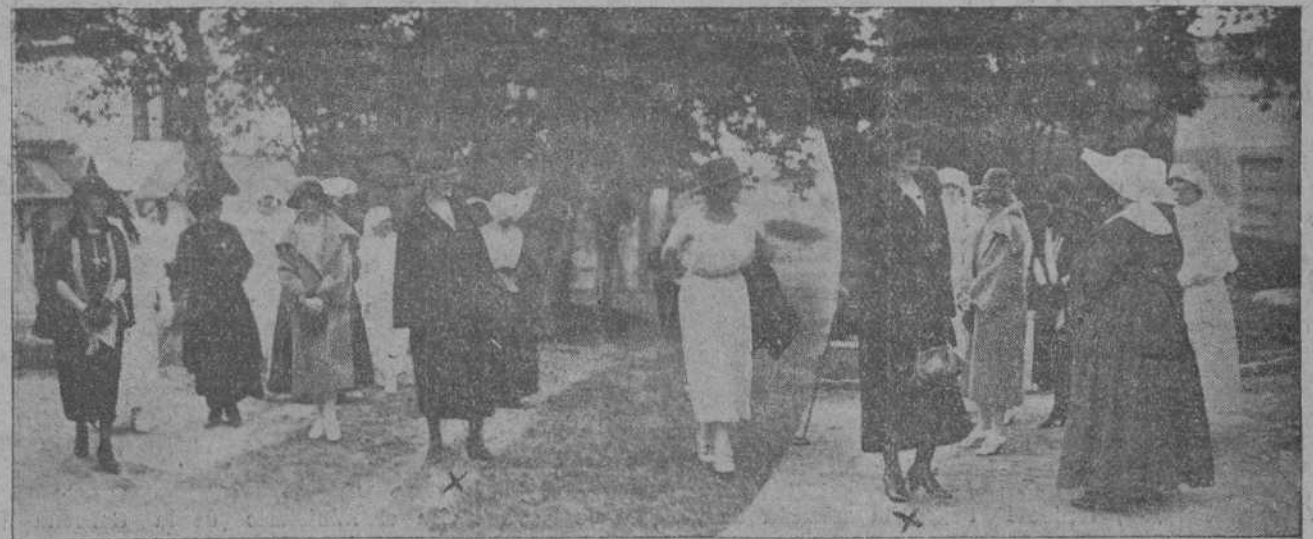
DOS MOMENTOS DE LA VISITA DE SU MAJESTAD LA REINA AL HOSPITALILLO DE ADARZO