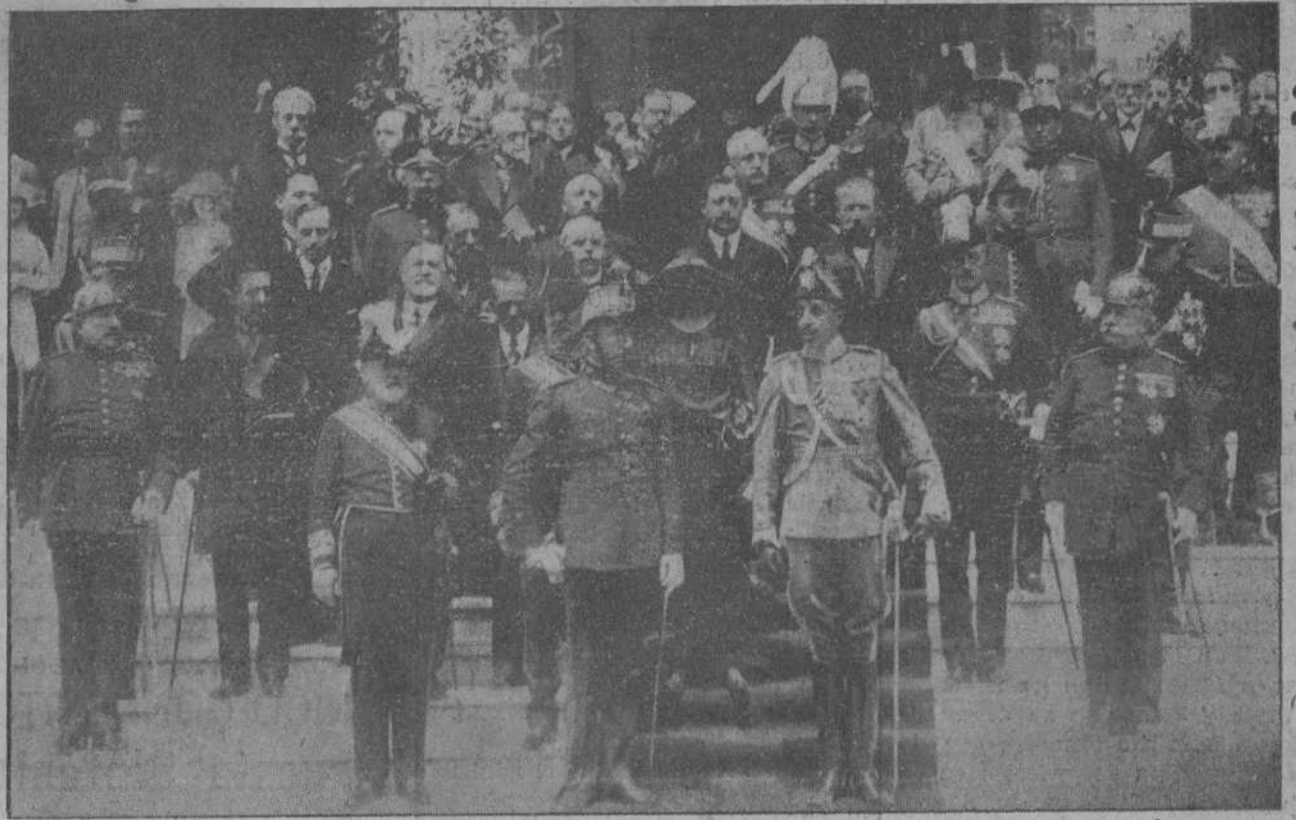
LA EXPOSICION DE BELLAS ARTES.—Su Majestad el Rey y los invitados, durante el acto inaugural.

retario, manifestándole que el presidente había recibido la visita de una comisión de la Cámara de la Propiedad de Melilla, presidida por el diputado señor Panjui, la cual había pedido un régimen civil para aquella población.