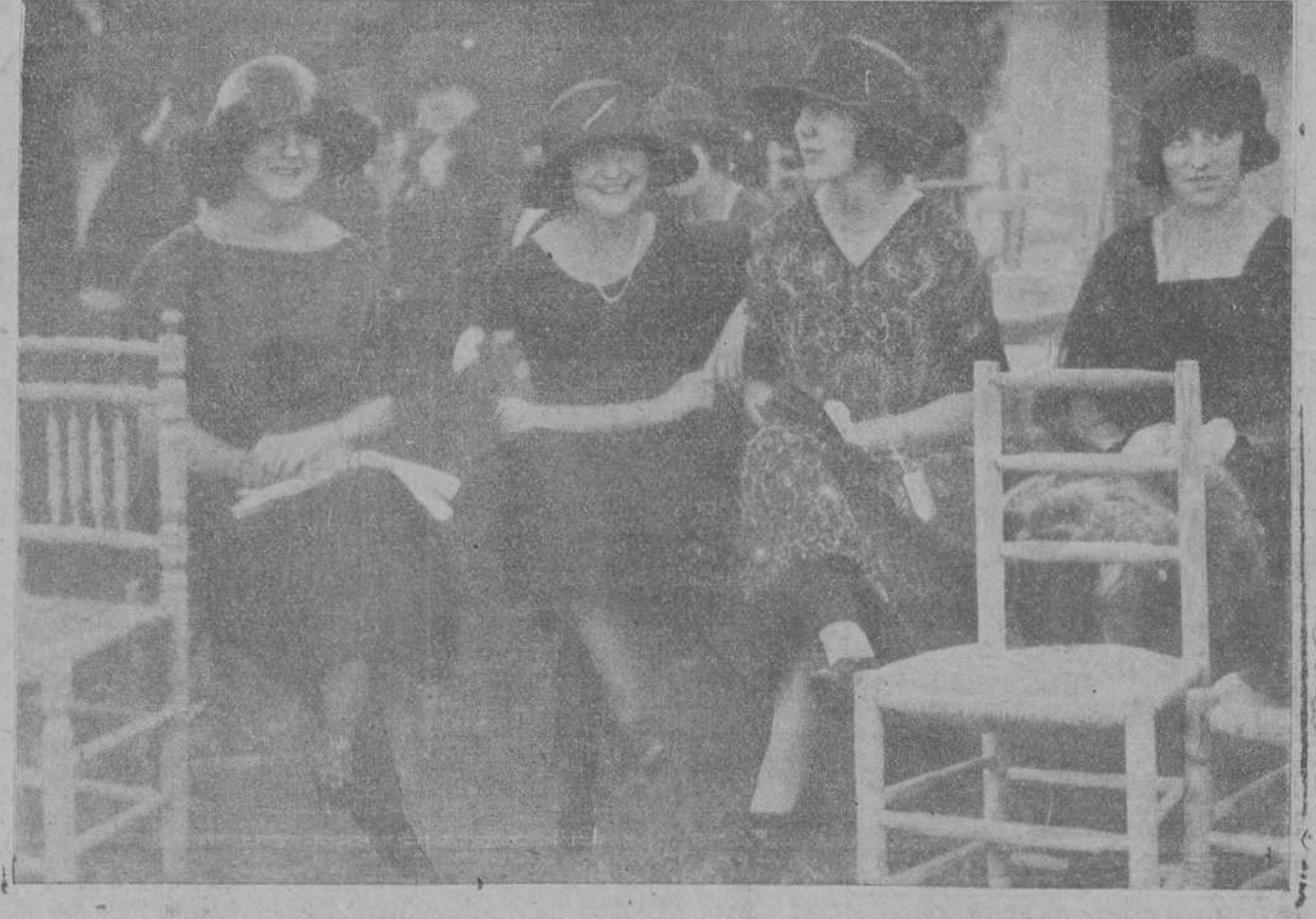
MADRID. GRUPO DE DISTINGUIDAS SENORITAS PRESENCIANDO LA CARRERA DE INAUGURACION EN EL HIPÓDROMO DE LA CASTELLANA.

La señorita de Martínez Anido las recibió muy afectuosamente y prometió empezar inmediatamente sus gestiones para obtener de Su Majestad la gracia pedida.