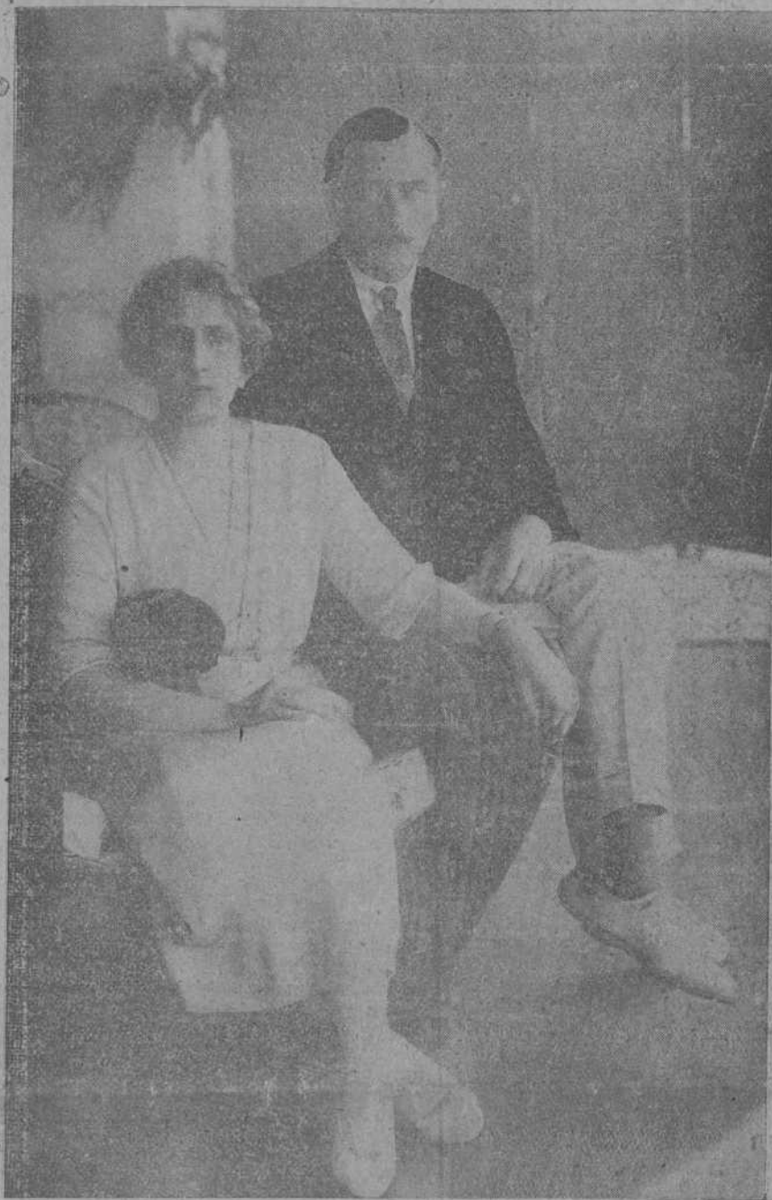
SU MAJESTAD LA REINA VICTORIA CON SU HERMANO EL PRINCEPE LEOPOLDO DE BATTENBERG, QUE HA MUERTO EN LONDRES A CONSECUENCIA DE UNA OPERACION QUIRURGICA

Rechazamos, desde luego, el artículo del colega y le rogamos que sea más justo en sus apreciaciones cuando juzgar los fines de la labor de compañeros de profesión se trate.