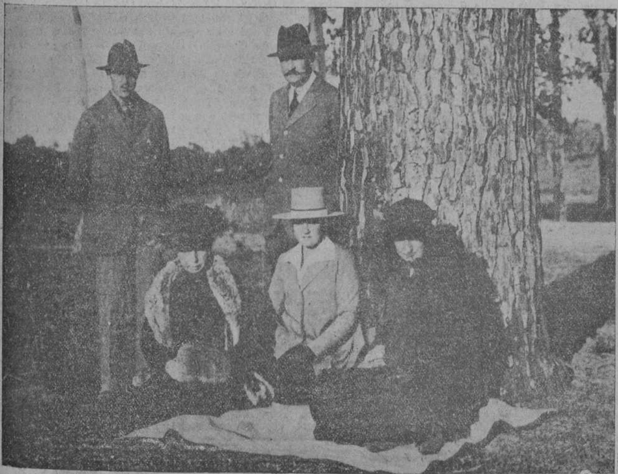
EN EL COTO «EL GATO», DE VILLAMANRIQUE.—La Reina doña María Cristina, con los infantes don Carlos y doña Luisa y sus nietos, los infantes doña Isabel y don Alfonso, este último reponiéndose en dicha posesión de la enfermedad contraída en Africa.