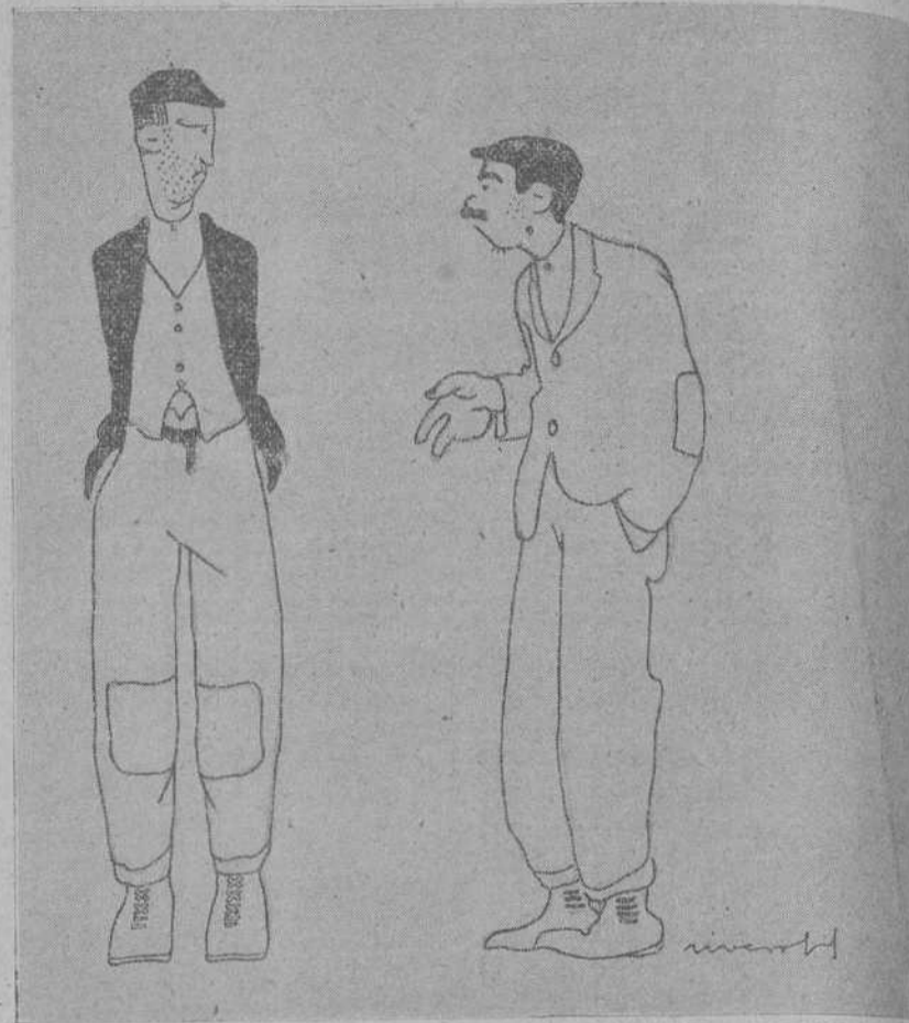
—Nosotros los «demócratas» verdaderamente avanzamos, no nos indignamos por lo de Dato. Nos tié más cuenta callar...

Después de diez y siete años de pontificado, antes de cumplir los cincuenta y cuatro años de edad, fue nombrado, por Real decreto de 21 de noviembre de 1918, arzobispo de Burgos y preconizado el 7 de enero de 1919. Y en el Consistorio de anteaño, 6 de febrero de 1921, Su Santidad Benedicto XV premió sus méritos y trabajos nombrándole cardenal del Sacro Colegio.