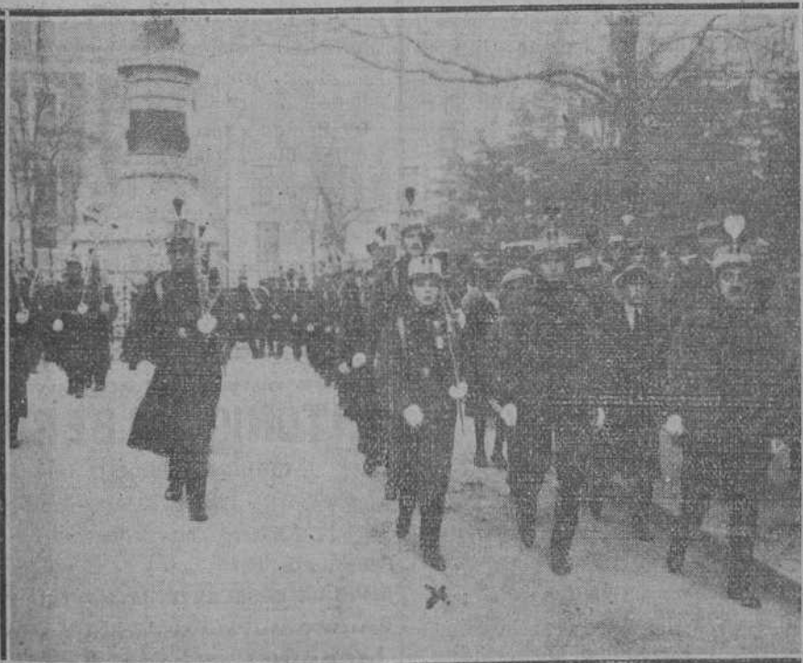
MADRID.—La fiesta de la Furisima.—El príncipe de Asturias, en formación con su Regimiento, de sfilando por la calle de Felipe IV.

HORAS DE DESPACHO EN ESTA ADMINISTRACION: DE NUEVE A UNA Y DE TRES A SIETE.