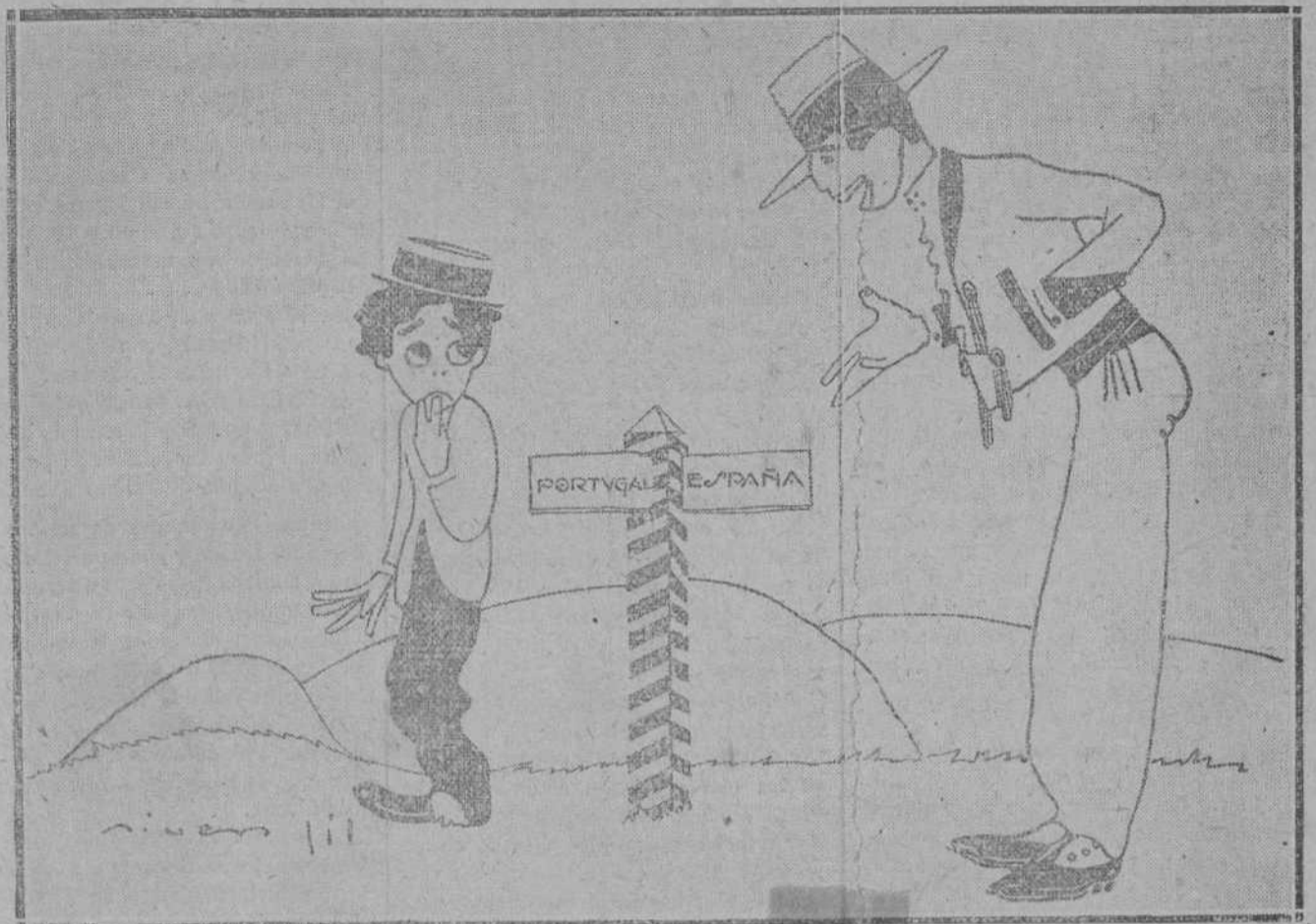
—DE MANERA, COMPARE, QUE SI TE ZAGO DER POZO ME PERSONAS LA VIDA, ¿VERDA?

mente, pero sin advertir la presencia del otro.