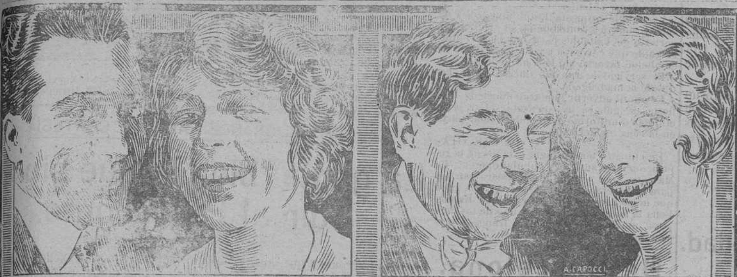
Estos usan Dentífricos CALBER Estos no usan Dentífricos CALBER