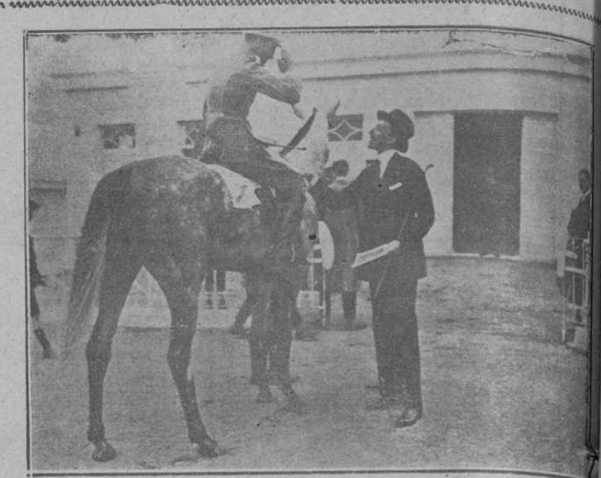
EN EL HIPÓDROMO.—SU MAJESTAD EL REY CONVERSANDO AYER CON EL MARQUÉS DE TRUJILLOS, A LA TERMINACION DE LA PRUEBA MILITAR.