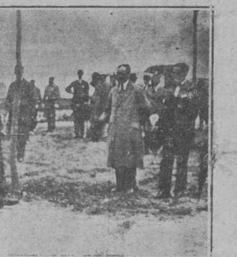
AYER EN EL HIPÓDROMO.—SU MAJESTAD LA REINA, EL PRINCIPE DE ASTURIAS Y EL INFANTE DON ALFONSO, PASEANDO POR EL "STAND" DURANTE UN DESCANSO.

Conducido al botiquín se le apreciaron heridas de gran importancia en la cabeza, otra extensa en una pierna y la fractura del brazo derecho.