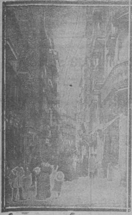
CALLE DE SAN FRANCISCO