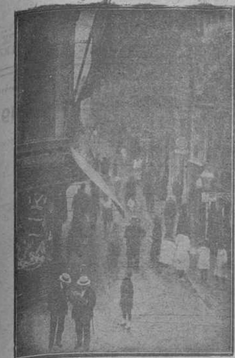
CALLE DE SAN FRANCISCO