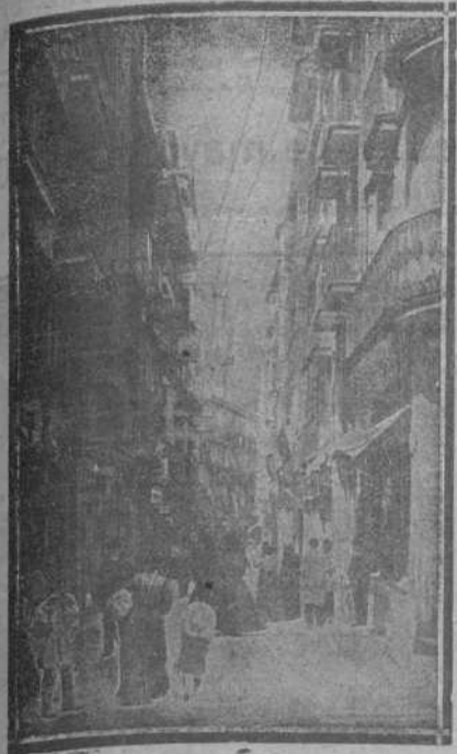
CALLE DE SAN FRANCISCO