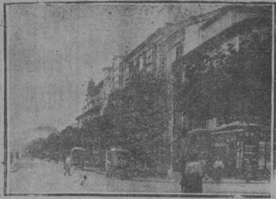
CALLE DE AMOS DE ESCALANTE