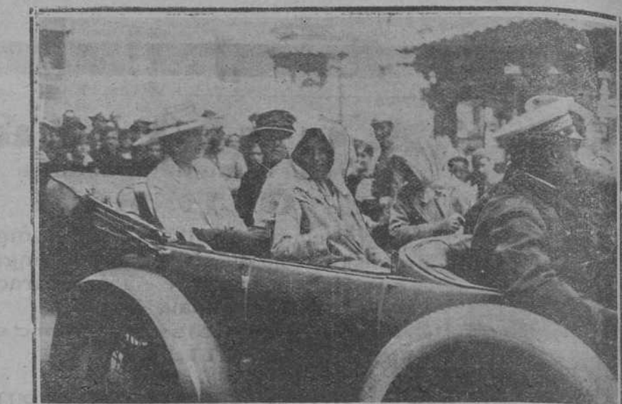
Su Majestad la Reina y las infantas doña Cristina y doña Beatriz, acompañadas por las señoras duquesas de Talavera y de la Victoria, paseando en automóvil ayer mañana por las calles de Santander.

La próxima regata se celebrará el próximo domingo, a las diez y media de la mañana.