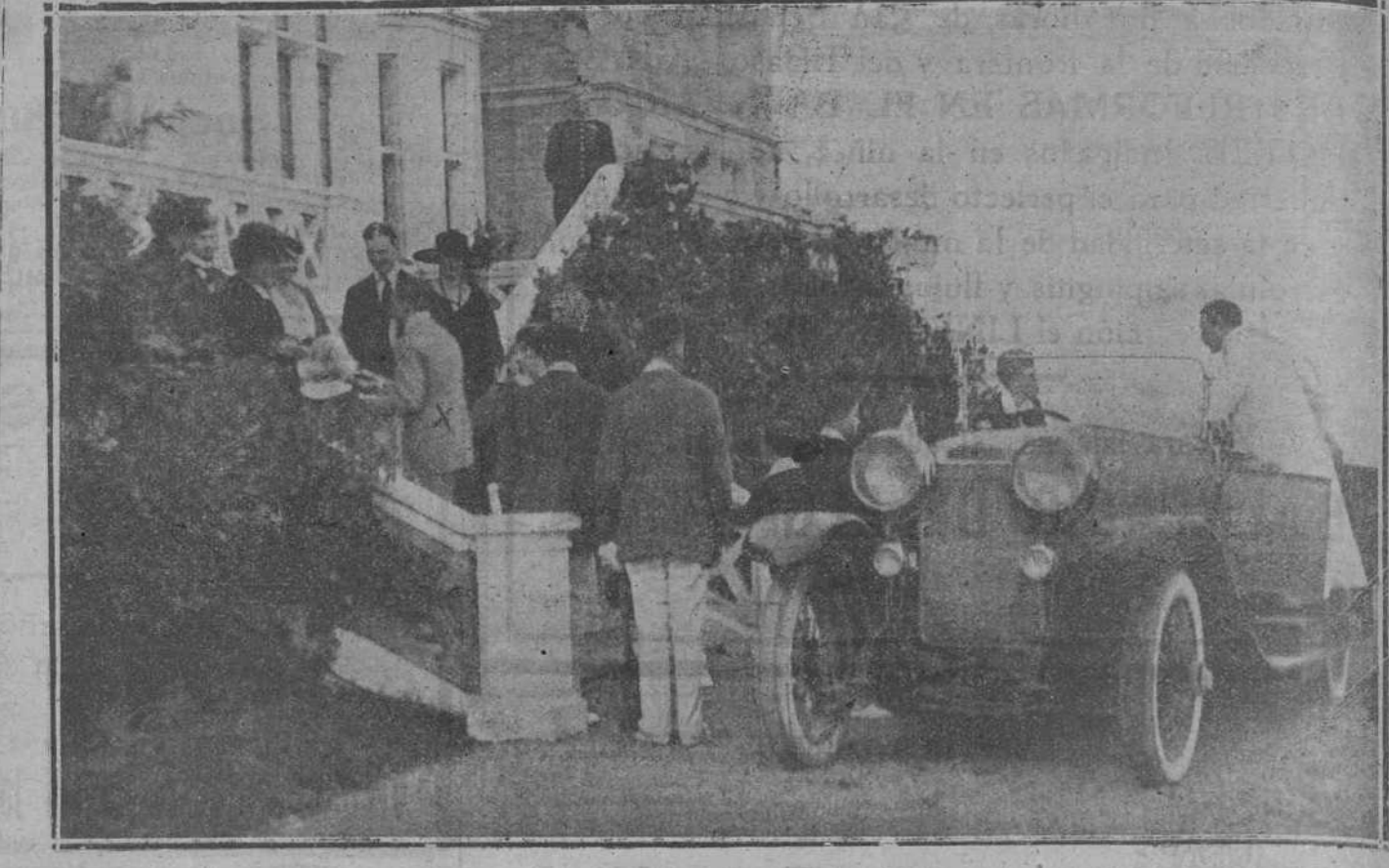
Su Majestad el Rey (x) saludando a las personas reales que le esperaban en la escalinata del palacio de la Magdalena. En el auto, el príncipe de Asturias ha blando con el chófer.