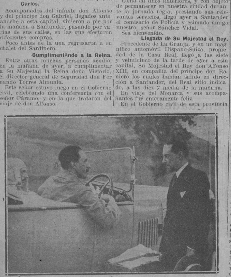
El alcalde de Santander saludando al Rey en la entrada de la población.

Se está organizando para el día de mañana, en los Campos de Sport, una romería montañesa, que promete estar animadísima, a juzgar por el buen sabor que la gente joven dejó la celebrada el pasado domingo y a las insistentes peticiones de los organizadores han tenido para su petición.