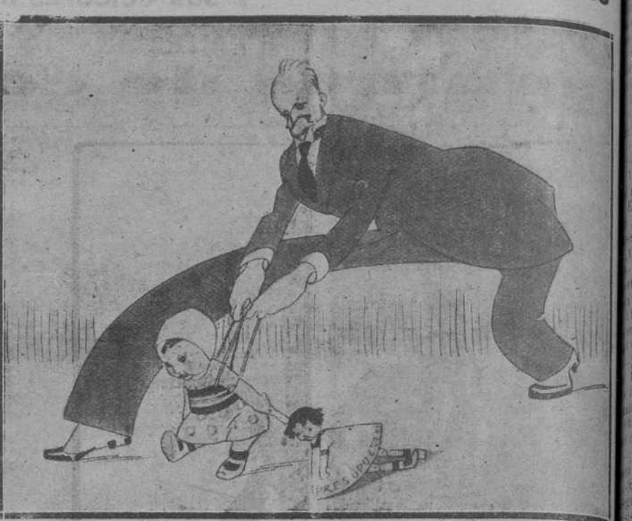
EL CONDE.— Procura no tropezar, m. nin, no sea que nos caigamos los dos.

El de hoy es la representación del grandioso drama de Ibsen «Espetáculo», que, como de sobra saben los lectores, es una de las obras cumbres del teatro universal y, desde luego, la mejor de las del famoso dramaturgo noruego.