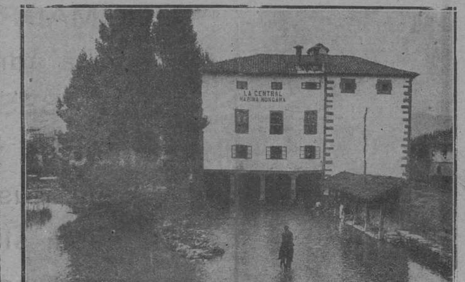
EN REINOSA.—Vista de la fábrica de harinas «La Central».