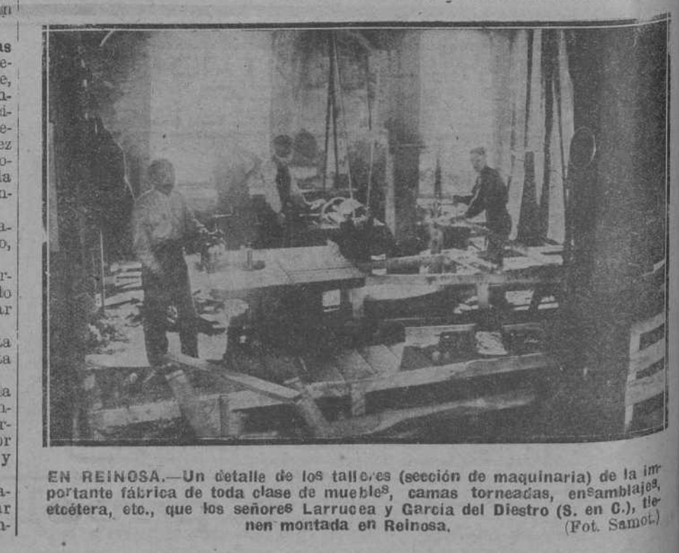
EN REINOSA.—Un detalle de los talleres (sección de maquinaria) de la importante fábrica de toda clase de muebles, camas torzadas, ensamblados, etcétera, etc., que los señores Larrucea y García del Diestro (S. en C.), tienen montada en Reinosa.