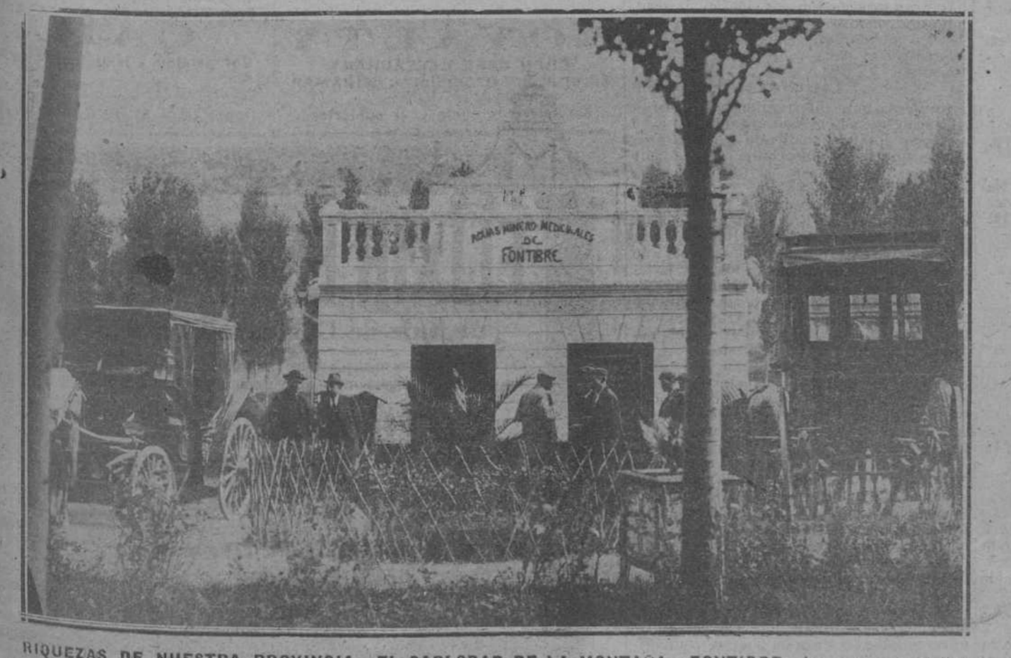
RIQUEZAS DE NUESTRA PROVINCIA. EL CARLSBAD DE LA MONTAÑA. FONTIBRE: La casa manantial de las muy prestigiosas aguas.