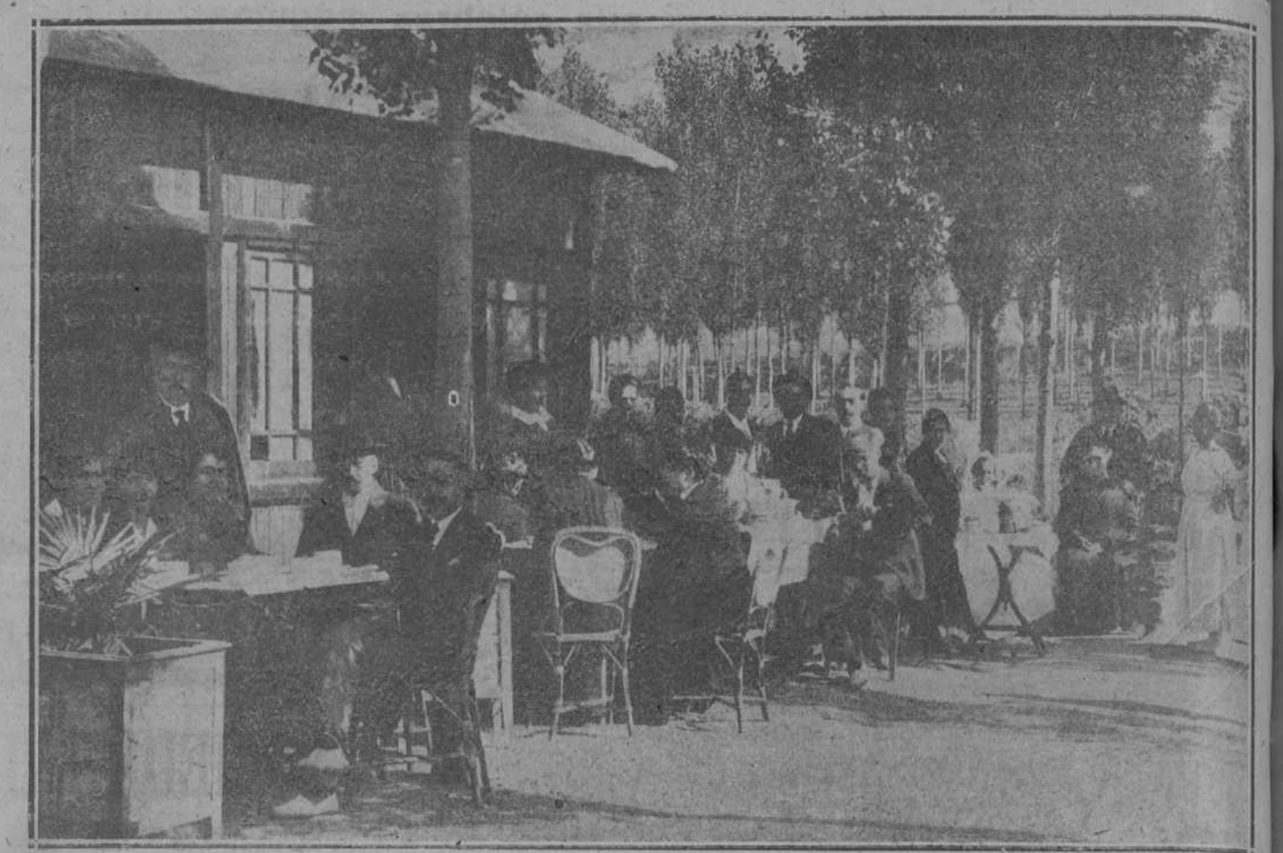
FONTIBRE.—Grupo de agüistas tomando el desayuno.