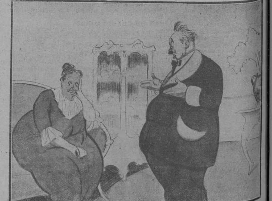
—La verdad, hija, no sé por qué te quejas. ¿No os he obsequiado a la niña y a ti con un kililo de carbón de tasa, que es lo que menos abunda? ¡Pues no que no es para presumir y tener humos con ese carbón!

En h MADI gar el pies de La fie brillan que cay jal y a los sop Cuaric Marquii al acto. Pueno A las tumbre, distas l civil de Gobierno Comer señor L haberse de Subs nie faci Reunio campo c del carb año, e de la P. de la gre por el se hic ncreta que de llegado i bón, cuy tido por habían previsiva al que que si giran e en t rables, p das, el s practiqu que se h para co nuevamen En ate don de d tontos es el presid sente con de los q por tant combusti según la que debe de exami y el ab ción, al que con ga de car gremio q consumo drán ven guna otr Adem carbón e la relació pacíficame dido, dor necesario La Junt do que no se re cantidad de los se rogarles f porte car la Patria Después dos, se oc en su d dispensio La Junt en su d levantó a Un con al gvern —Y de —Pues, Lassarra Caridad estancia Sarriach esta amp guía, m nir en S. Acaso— con el fin espectac lucha có Pastor, a hay hasta le nada h autorizaci Caridad en tal sen que más la benefi Y despu presiones al progr cimo, no nador civil Not MADRI artística crucebas de en el En dich guías se —La m jo han co lina. —El Re duque de de Vigo y Riasta Hoy, a l güendó y si el t después vena, a que recor donado e El Pad illos sa santander Acudire sabr la v para hom su fiesta a las diez oficiando nels y me dola por los balcon es de la