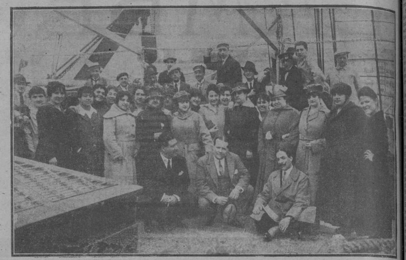
El popular actor Casimiro Ortas, rodeado de los artistas que componen su notable compañía, a bordo del «Alfonso XII» y momentos antes de zarpar con rumbo a la Habana.