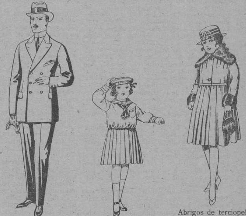
Trajes de cheviot, melton. De ptas. 28 a 85. Los mismos en vicuña o jerga. De ptas. 32 a 90. Trajes de marinera de sarga inglesa azul, para niñas de 4 a 9 años. De pes. tas 30 a 38. Abrigos de terciopelo de lana, pañete, gamuzza etc., cuello y b. camangas piel, para niñas de 4 a 9 años. De ptas 28 a 48.