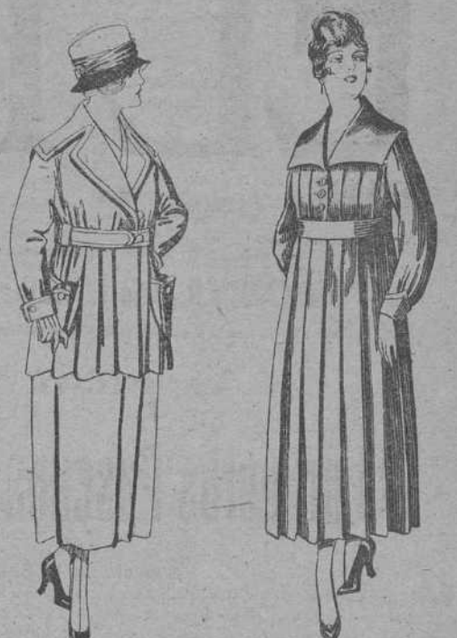
Paletots felpa, diferentes colores. De pesetas 61 a 65. Batas de lanilla, diferentes colores. A pesetas 25.

Ultimas novedades en echarpes, manguitos, pelerinas, corbatas, abrigos, etc., en pieles de loutre, taupe, vison, renard, zibelina, armiño, etc., auténticas e imitación perfecta.