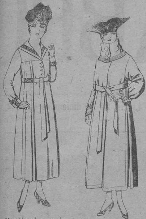
Vestidos de sarga inglesa, en negro, azul y color, bordados. De pesetas 61 a 73. Abrigos de pañete, colores azul, beige y café. De pesetas 65 a 85.

Ropas confeccionadas para caballero, señora, niño y niña.