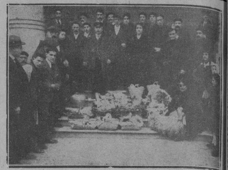
LA FIESTA MAURISTA DE AYER.—Varios mutualistas con los lotes que les correspondieron en el reparto.

A nuestros suscriptores de fuera Estando próximo a vencer el semestre de suscripción, rogamos encarecidamente a nuestros suscriptores de fuera de la capital se apresuren a hacer efectivo el importe de la misma.