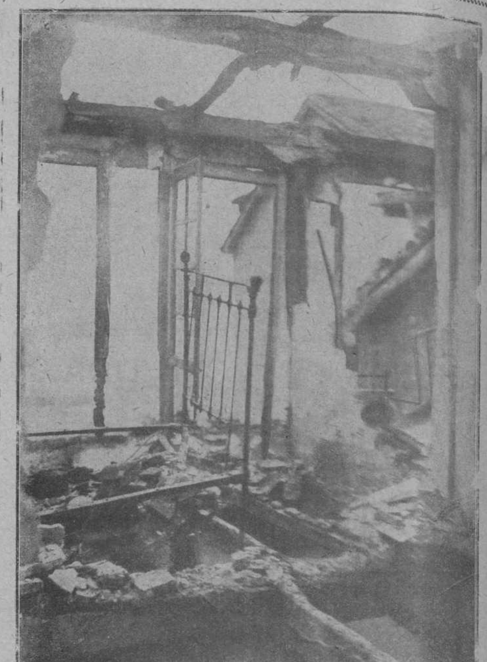
DEL INCENDIO DEL VIERNES.—Un aspecto del interior de la casa quemada en el Prado de San Roque.