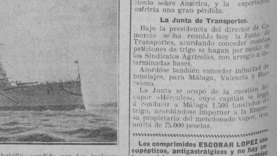
INDEFATIGABLE, crucero acorazado de batalla, perdido por los ingleses en el combate de Skager-Rak. Desplazaba 18.750 toneladas; sus máquinas tenían una fuerza de 43.000 caballos, con la cual alcanzó, en las pruebas, una velocidad de 29,13 nudos. Su armamento consistía en ocho cañones de doce pulgadas, 16 de cuatro pulgadas y dos tubos lanzatorpedos. Fué botado en 1911.