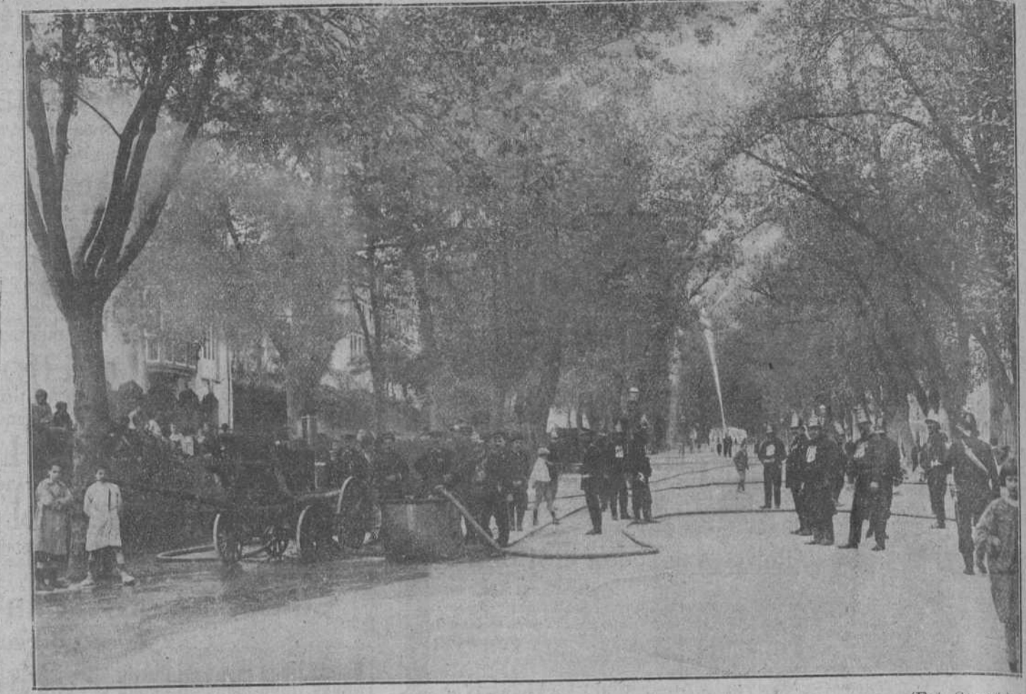
Los hombres voluntarios durante la revista efectuada ayer.

ANTONIO ALBERDI QUIRUGIA GENERAL Partos.—Enfermedades de la mujer.—Vias urinarias. AMOR DE ESCALANTE, 19. 1.º