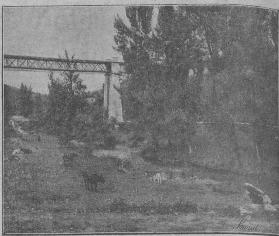
Puente del ferrocarril en Beranga.

No hace muchos días que un ilustrado Padre Agustino relataba detalladamente