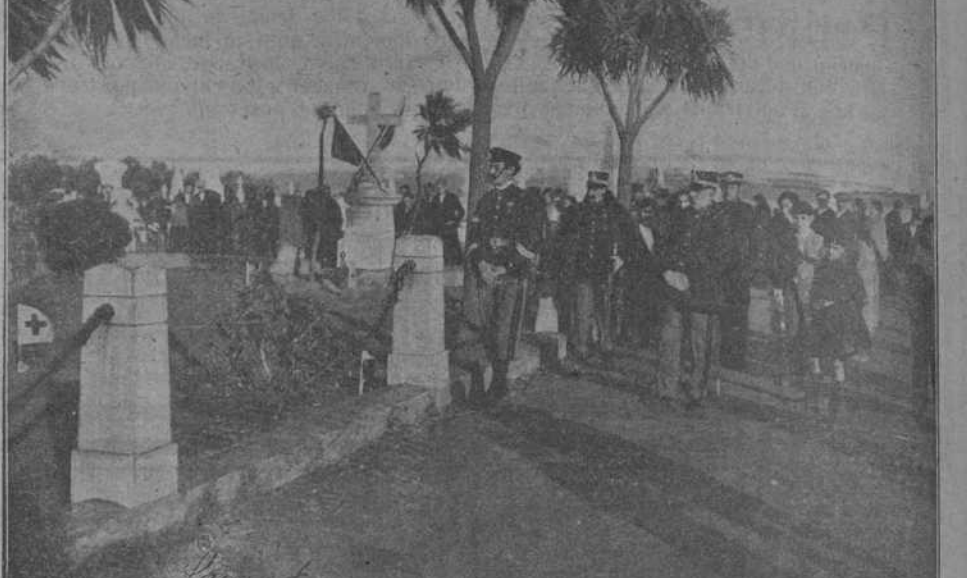
AYER, EN CIRIEGO.—En la tumba de los repatriados de la guerra de Cuba.

Desde el fondo de mi corazón os doy las gracias y os felicito.»