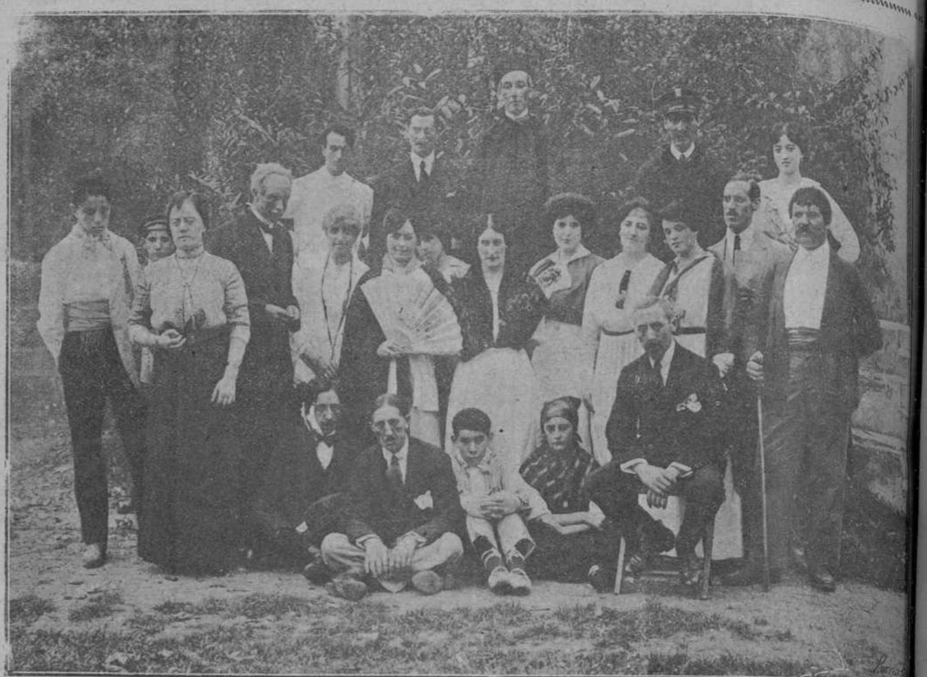
UNA FIESTA EN EL CASINO DE SOLARES.—Distinguidos jóvenes de la colonia veraniega que representaron con gran éxito «La rebolita» y «Las casas de cartón».

Al primero Dominguez le torea movido, y en la hora suprema está valiente,