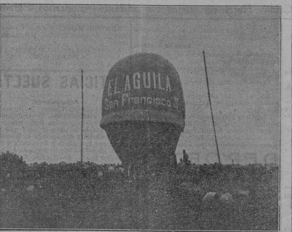
EN LOS CAMPOS DE SPORT—GLOBO CONSTRUÍDO CON MATERIALES ADQUIRIDOS EN LOS ALMACENES DE EL AGUILA

9.ª.—Fiesta en la plaza de la Constitución, con retreta de fuegos artificiales. 10.ª.—Fiesta en la plaza de la Constitución, con retreta de fuegos artificiales.