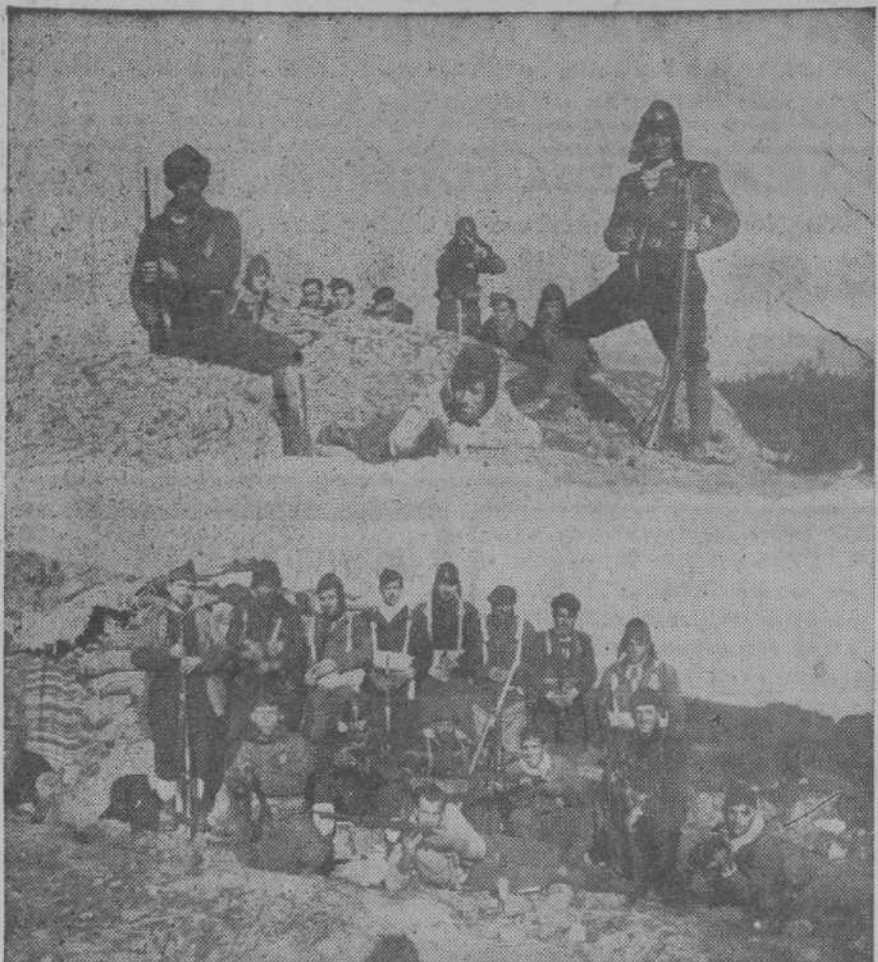
EN LOS FRENTES DEL NORTE.—Grupo de componentes de la Guardia Nacional Republicana, que con su «foto» nos envían un cordial saludo para que desde LA VOZ DE CANTABRIA se lo trasmitamos a sus familiares y amistades.

¡Ciudadano! Piensa que la tómbola benéfica de ASISTENCIA SOCIAL no es un recreo más. Se trata de procurar que, insensiblemente, todos seamos colaboradores del fin humanitario que se persigue.