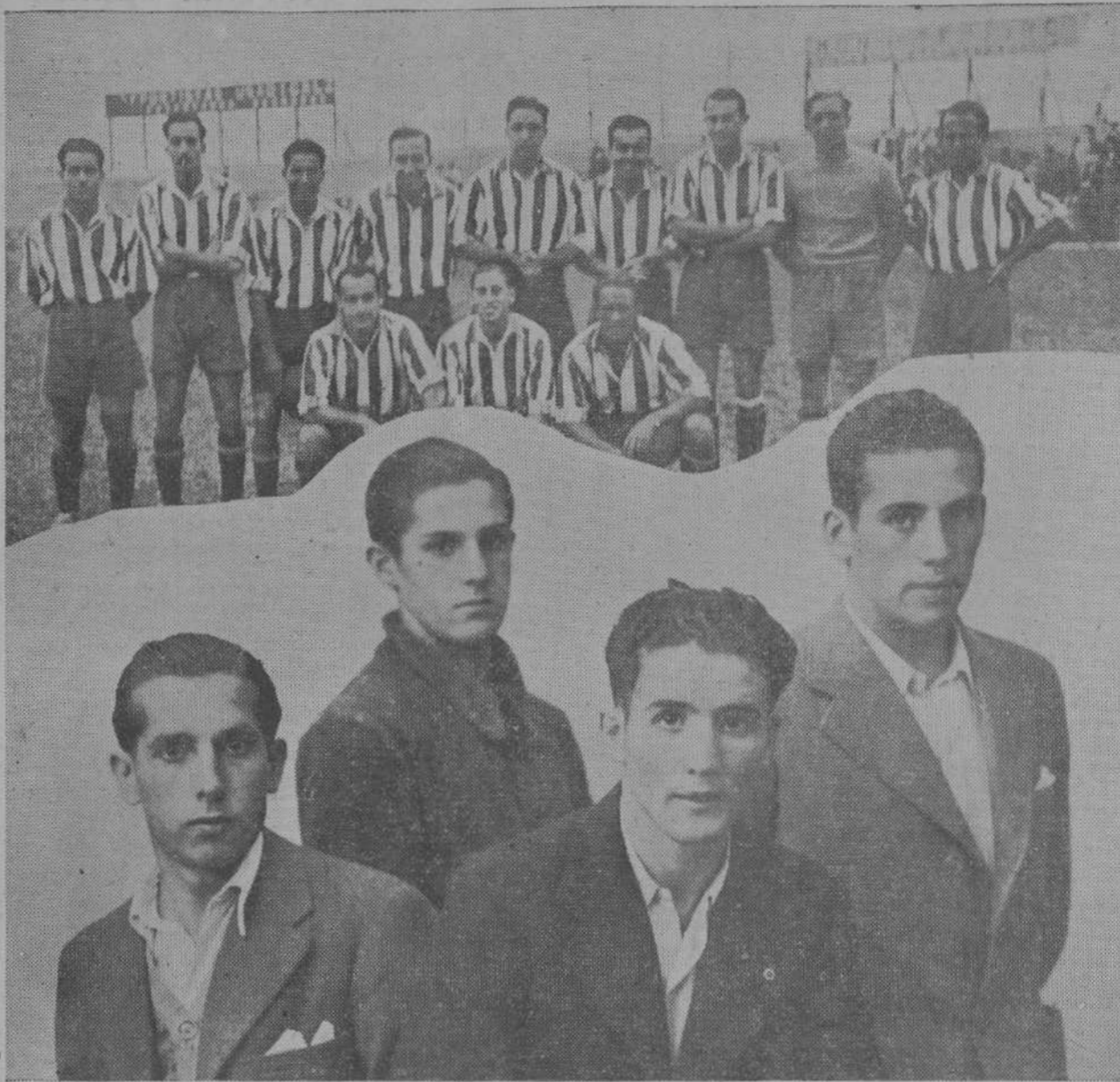
La selección asturiana y los boxeadores que han tomado parte en las fiestas deportivas londinenses en los Campos de Sport y Salón Gong.