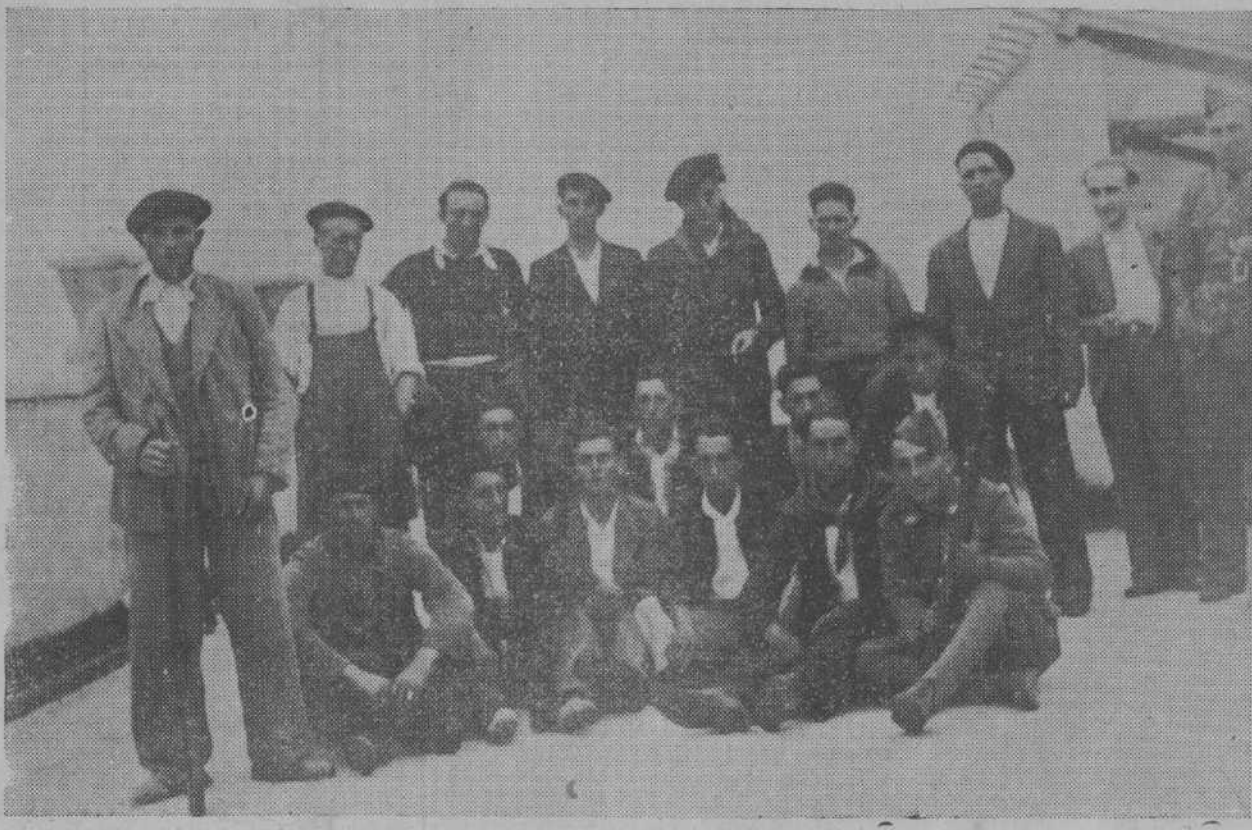
ARIJA, ALERTA.—Además del ejército de milicianos de la localidad, Arija cuenta con numerosos soldados campesinos huídos de sus pueblos natales, tierras de Burgos adentro, que empuñan las armas en defensa de la Libertad del pueblo. He aquí uno de los muchos grupos de que se compone el numeroso ejército que opera en Arija frente a la sedición.