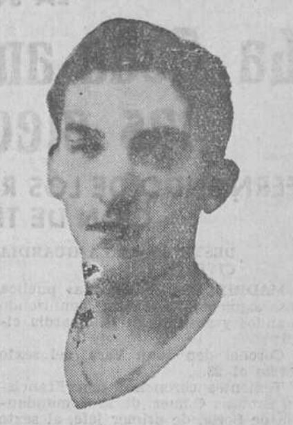
GERMAN. ¿Será Germán ese medio centro que el Racing necesita para un encuentro de tanta responsabilidad como el del domingo?

hay que meter cuatro goles por lo menos, y esto, que a algunos pesimistas les parece casi irrealizable, lo ha hecho el Racing, sin darle mayor importancia, en siete de los once partidos de Liga jugados esta temporada, en que ha marcado precisamente cuatro goles a Barcelona, Español, Madrid y Hércules, cinco al Betis y Athletic de Madrid y seis a Valencia. Claro que además de esto tendrá que atender mucho a su propia defensa para que el contrario no le marque goles; pero ello, que tiene sus dificultades, no es tampoco una cosa del otro mundo, ya que también suele ser muy difícil para los equipos visitantes perforar la portería contraria, y así hemos visto este año que equipos como el Barcelona, Español y Sevilla no lo consigieron y el Athletic de Bilbao, Osasuna y Betis sólo lo lograron una vez. Quizá el pesimista insista en que son muy diferentes los partidos de Copa a los de Liga y que los equipos en la segunda vuelta vienen dispuestos a defenderse y a conservar la ventaja, pero en el juego todo falla, e incluso muchas veces estas tácticas lo que hacen es facilitar la labor del contrario. Nada, pues, de derrotismos anticipados, sino todo lo contrario; los entusiastas y la afición en general lo que debe hacer es acudir el domingo a los Campos a animar a sus jugadores, que están deseando sacarse la espina, lo que conseguirán a poco que les acompañe la suerte.—X.