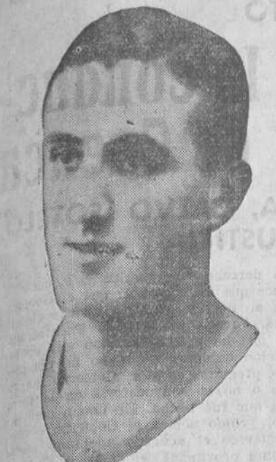
GARCIA. ¿Será García el medio centro para el próximo partido, en los Campos, contra el Osasuna...?

Alrededor de él se hacen las más variadas conjeturas y no todos creen que los santanderinos estén ya eliminados de la Copa España