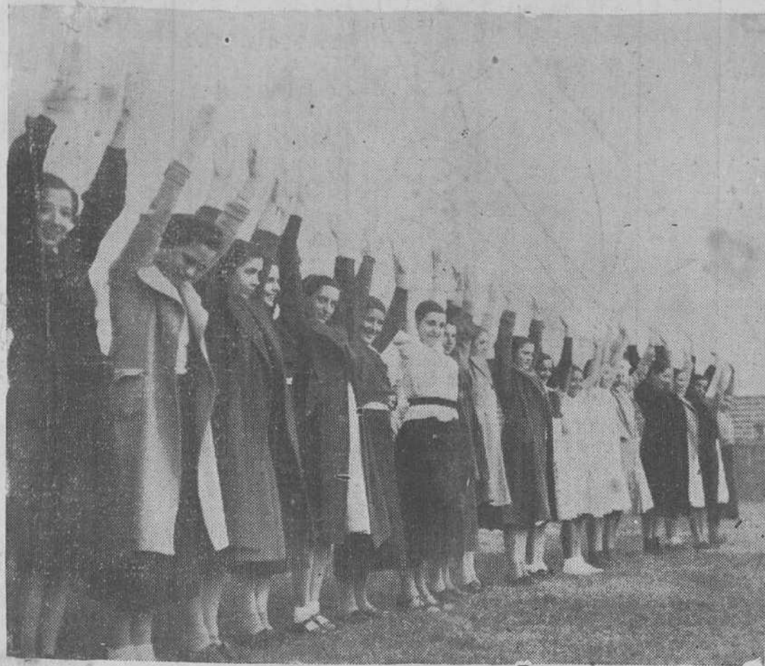
En la tarde de ayer fueron inauguradas en el campo de la Magdalena las clases de cultura física al aire libre del Instituto de Menéndez Pelayo. La «foto» recoge un momento en que las niñas hacen gimnasia.

Hasta la fecha, la viabilidad de estas candidaturas, no obstante el visto bueno que les han dado los comunistas, no pasa de ser hipotética. Como hipotético es el triunfo completo del Frente Popular y la formación de un Gobierno estable salido de él. Para reforzar el primero se quiere que la jornada de hoy en París transcurre sin incidentes, a fin de no asustar a los electores. Para lograr lo segundo trátase de neutralizar la tendencia del sector radical inclinado hacia la política moderada y centrista.