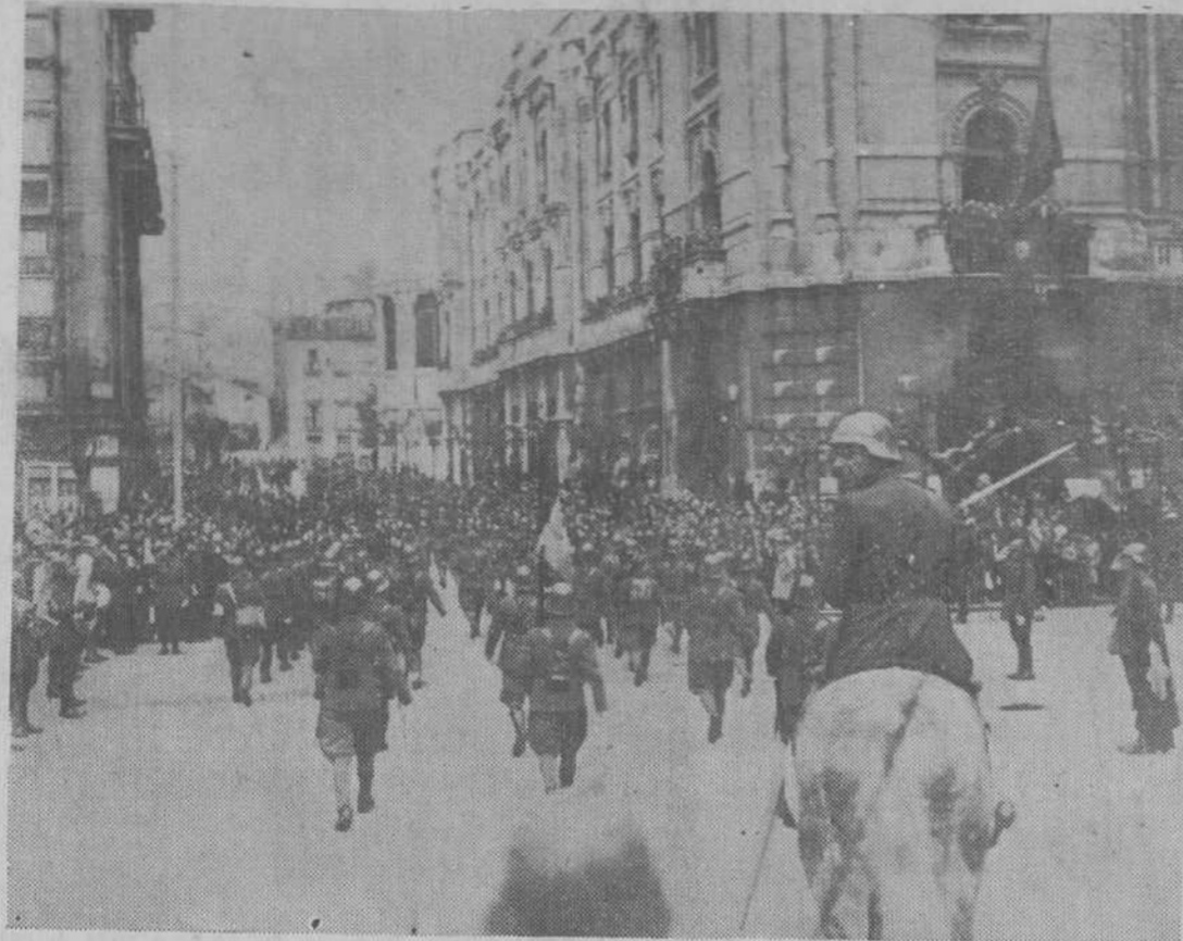
El regimiento Valencia llega al Ayuntamiento en el brillante desfile de ayer...