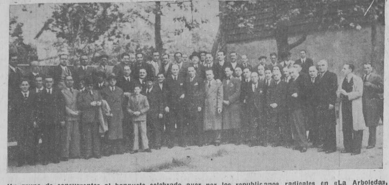
Un grupo de concurrentes al banquete celebrado ayer por los republicanos radicales en «La Arboleda», para conmemorar el quinto aniversario de la República.

CASA DE ANDALUCIA Excursión a San Vicente de la Barquera y Comillas. Día 3 de mayo. Precio 6,50 pesetas. Inscripciones en Conserjería, hasta el día 25.