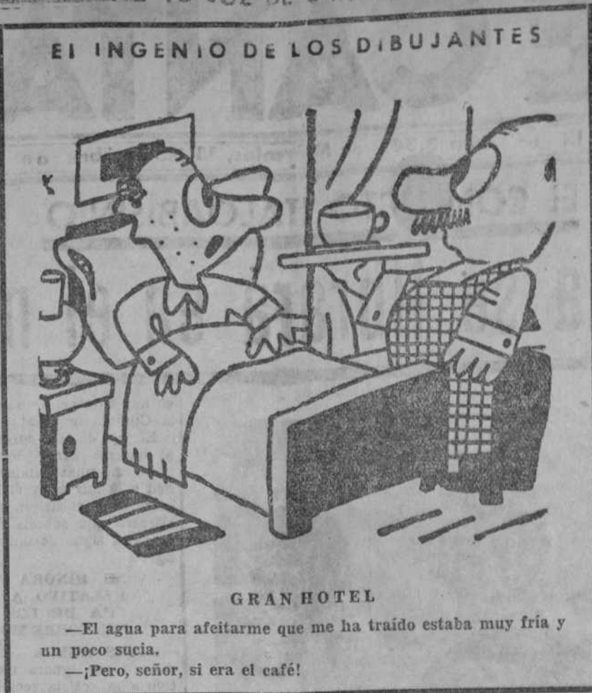
—El agua para afeitarme que me ha traído estaba muy fría y un poco sucia. —¡Pero, señor, si era el café!

Con motivo de celebrarse el próximo domingo, día 17, la colocación de la primera piedra de nuestro edificio social, que se levantará en el solar que para dicho fin se ha adquirido en la calle de Pedruca, se invita a todos los socios de este Ateneo a asistir dicho día, a las once de la mañana, a este acto.