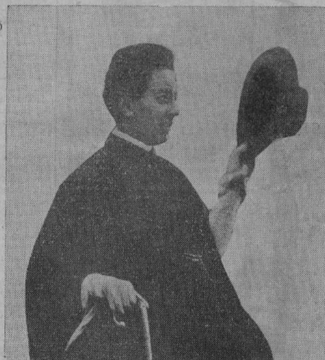
He aquí una reciente fotografía del príncipe Asfao, hijo del emperador de Abisinia, de quien se dice que ha muerto a consecuencia de un accidente de aviación.

ROMA.—El Gobierno italiano ha enviado una nota de protesta contra las sanciones a todos los países que han acordado la aplicación de las mismas, en la que se dice que se acusa a Italia de haber violado el artículo 12 del Pacto, no habiéndose tenido en cuenta las consideraciones que Italia ha formulado con respecto a la cuestión. Se añade que las autoridades civiles y religiosas de Abisinia no tienen sin duda en cuenta que los italianos han liberado a 16.000 esclavos. Se agrega, que con respecto a la aplicación de sanciones, cada Gobierno que