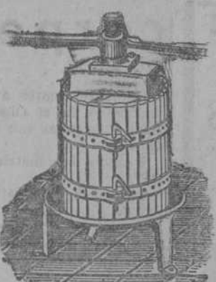
Prensas para uva y manzana desde 70 Ptas. Estructuradas para manzana...