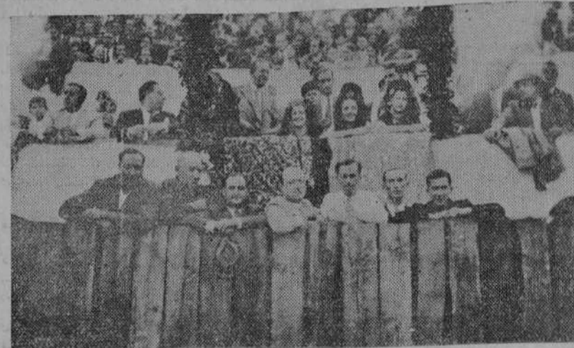
La presidencia—cuatro lindas señoritas—de la corrida celebrada el domingo en Torrelavega.