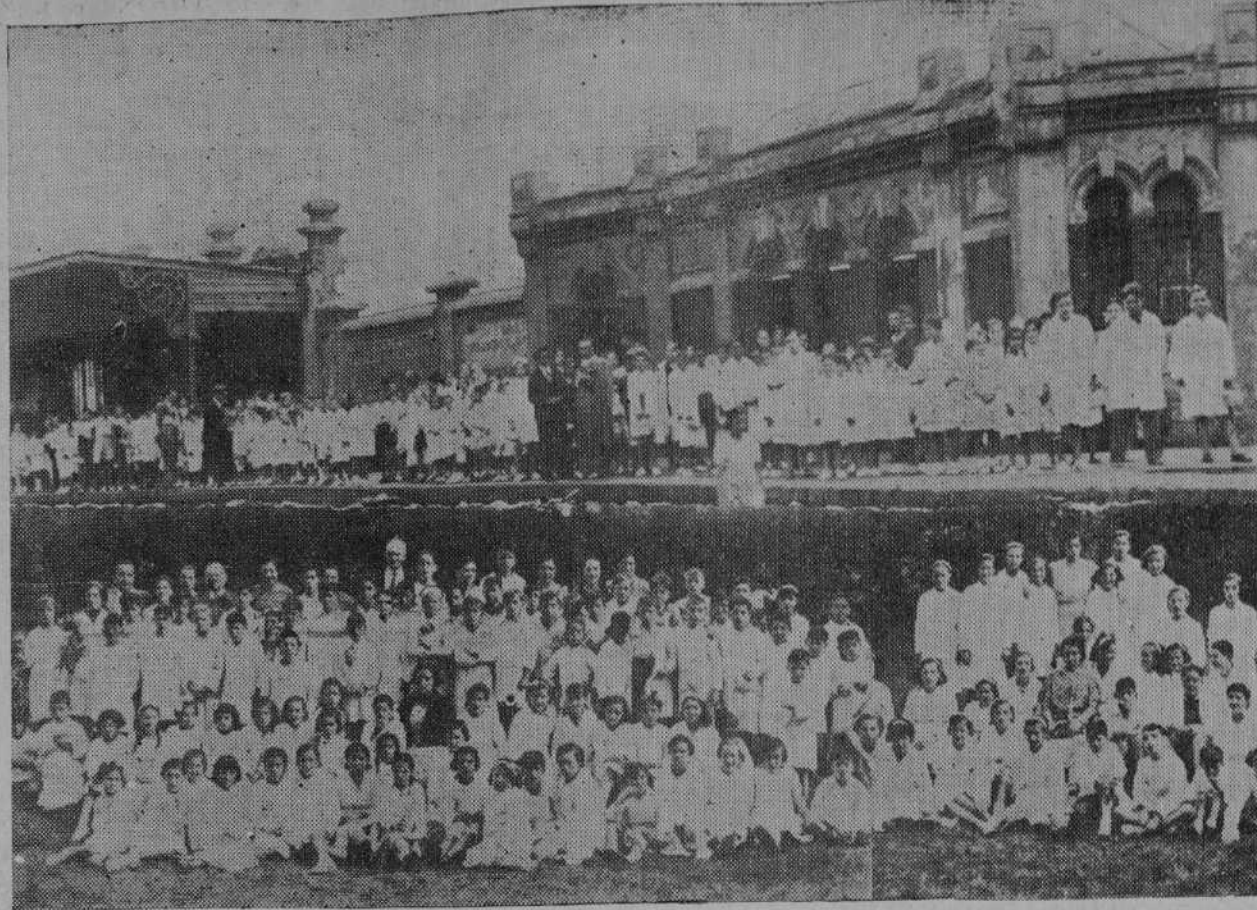
El grupo escolar «Ramón Pelayo» verificó el domingo una animadísima excursión a Alceda-Ontaneda. Asistieron cerca de seiscientos niños y unas doscientas personas mayores. Entre los expedicionarios se encontraban los cincuenta alumnos del «Grupo «Concepción Arenal», de Madrid, con sus profesores. En el grabado: Arriba, en la estación de Santander, los excursionistas esperan la formación del tren especial; abajo, a la derecha, los niños madrileños con sus profesores, y a la izquierda, algunos de los alumnos del grupo «Ramón Pelayo» acompañados de sus maestros.

La aportación más genuina que España hace a Roma en estos cinco siglos de «pax romana», es el senectus-