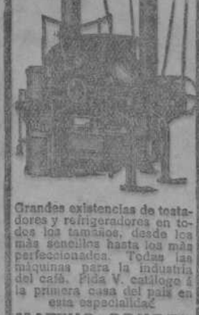
Grandes existencias de tostadores y refrigeradores en todos los tamaños, desde los más sencillos hasta los más perfeccionados. Todas las máquinas para la industria del café. Pida V. catálogo a la primera casa del país en esta especialidad.

TOSTADORES rápidos a aire caliente para café, cacao etc.