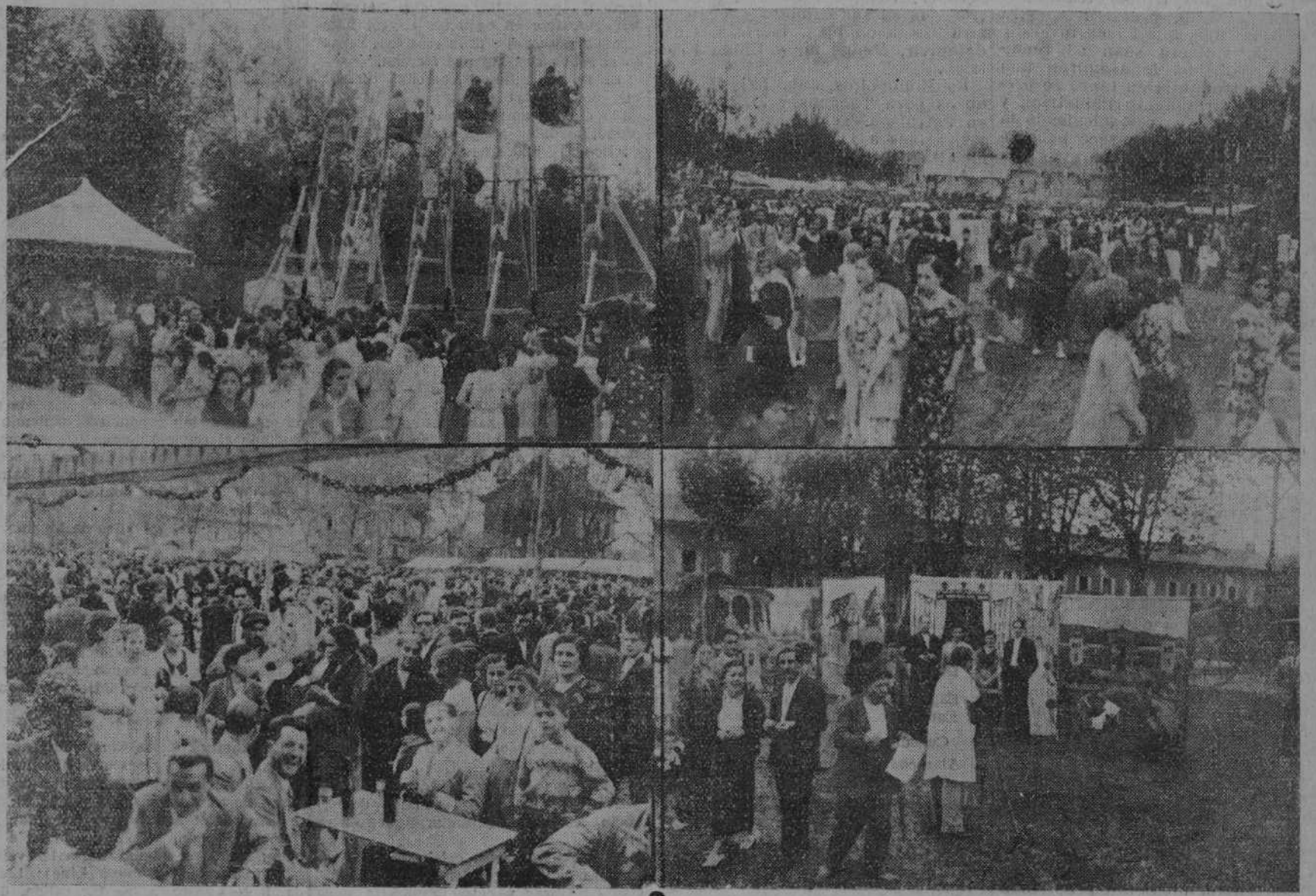
EL DOMINGO, EN BARREDA. La famosa romería de Santa María, como puede verse en las presentes «fotos» de Alejandro, resultó animadísima y brillante...