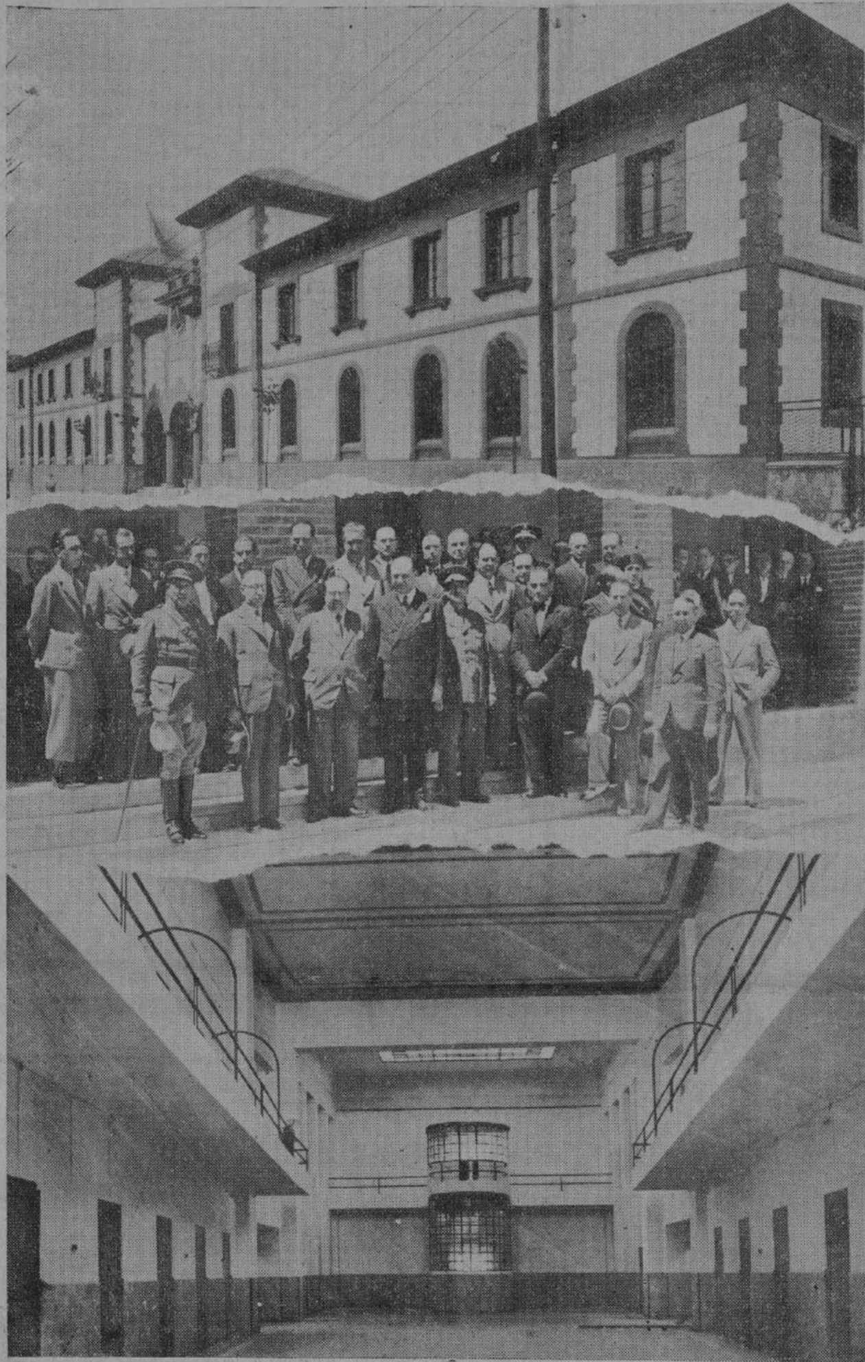
Aspecto exterior de la nueva Prisión provincial, cuya recepción oficial se verificó ayer mañana.—Las autoridades y las representaciones que asistieron al acto.—Un aspecto del pabellón central de la nueva Prisión.