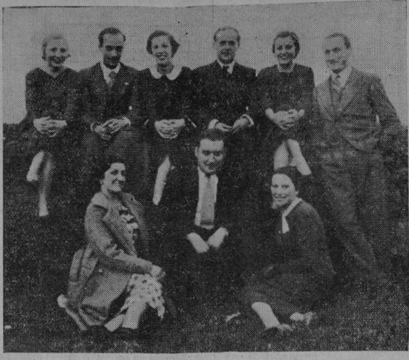
CAMPUZANO.—Un grupo de romeros asistentes a la clásica romería de San Migueluco, celebrada el domingo último.