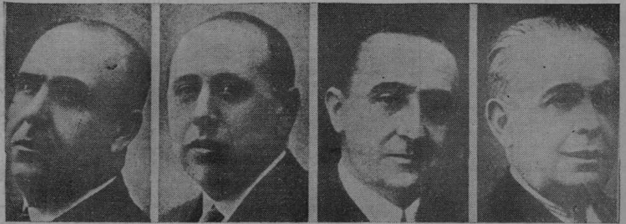
Señor Rocha, ministro de Estado. Señor Gil Robles, ministro de la Guerra. Señor Casanueva, ministro de Justicia. Señor Chapaprieta, ministro de Hacienda.