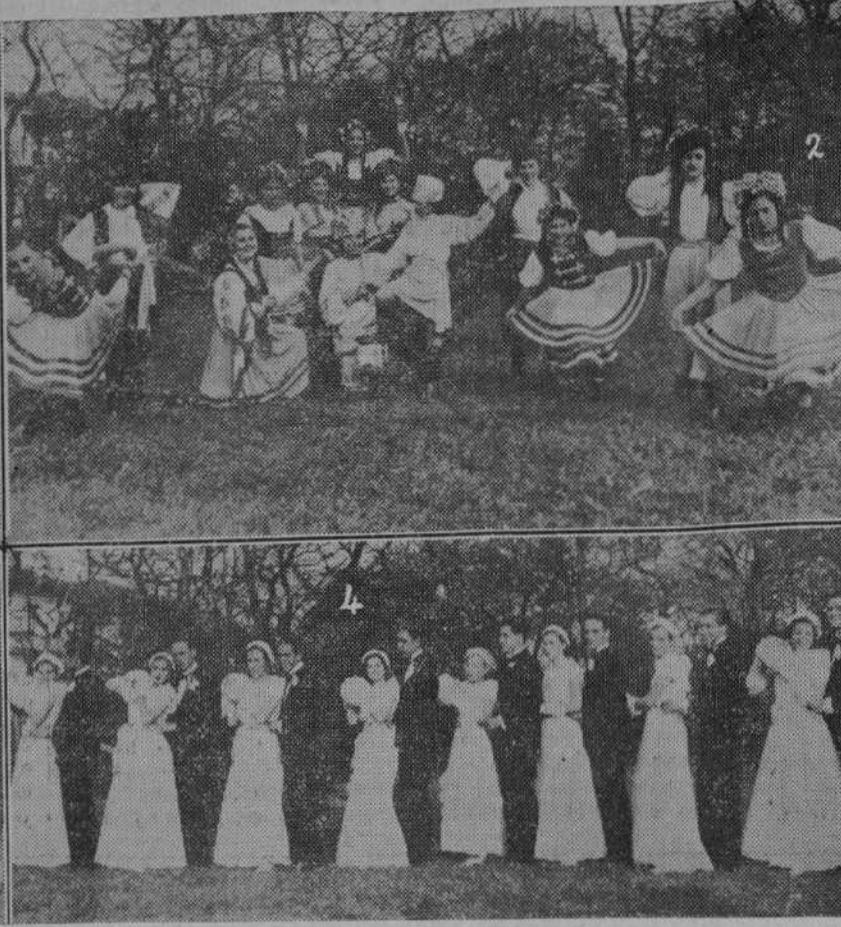
DEL FESTIVAL RECIENTE EN PEREDA.—En «Villa Piquion», nuestro colaborador gráfico señor Hojas hizo ayer estas interesantes fotografías de los grupos que actuaron en la fiesta del Patronato de la Sagrada Familia. En la primera aparecen los jóvenes que bailaron el danzón cubano; en la segunda, los que interpretaron bailes rusos; en la tercera, los del pericón argentino, y en la última, las parejas del foxo.