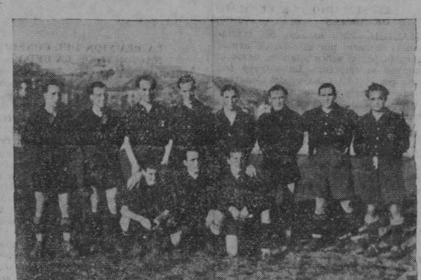
He aquí a los estudiosos «chicarrones» del equipo «A. Janssens», líderes del interesante torneo escolar, que se viene celebrando con inusitada expectación en los terrenos del Eclipse

movilidad, que, en verdad, cogió de sorpresa a los tolosistas.