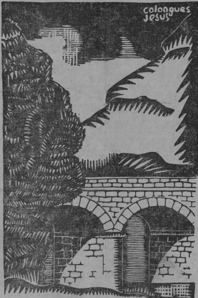
PUENTE DEL DIABLO

En vez, por ejemplo, de intentar el alza de las recaudaciones ferroviarias estimulando el tráfico, se intenta encarecerlo, como se encarece el trigo al no dejarle tomar los niveles normales de precios dentro de