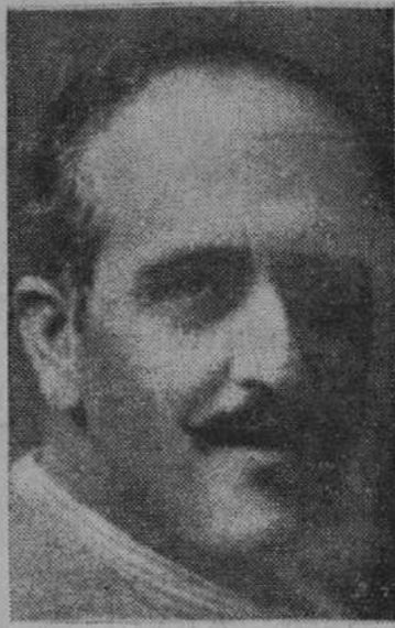
Don Eloy Vaquero, ministro de Trabajo.