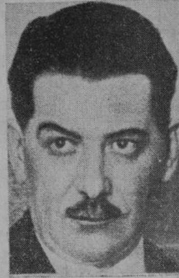
Don Rafael Guerra del Río, ministro de Obras Públicas.