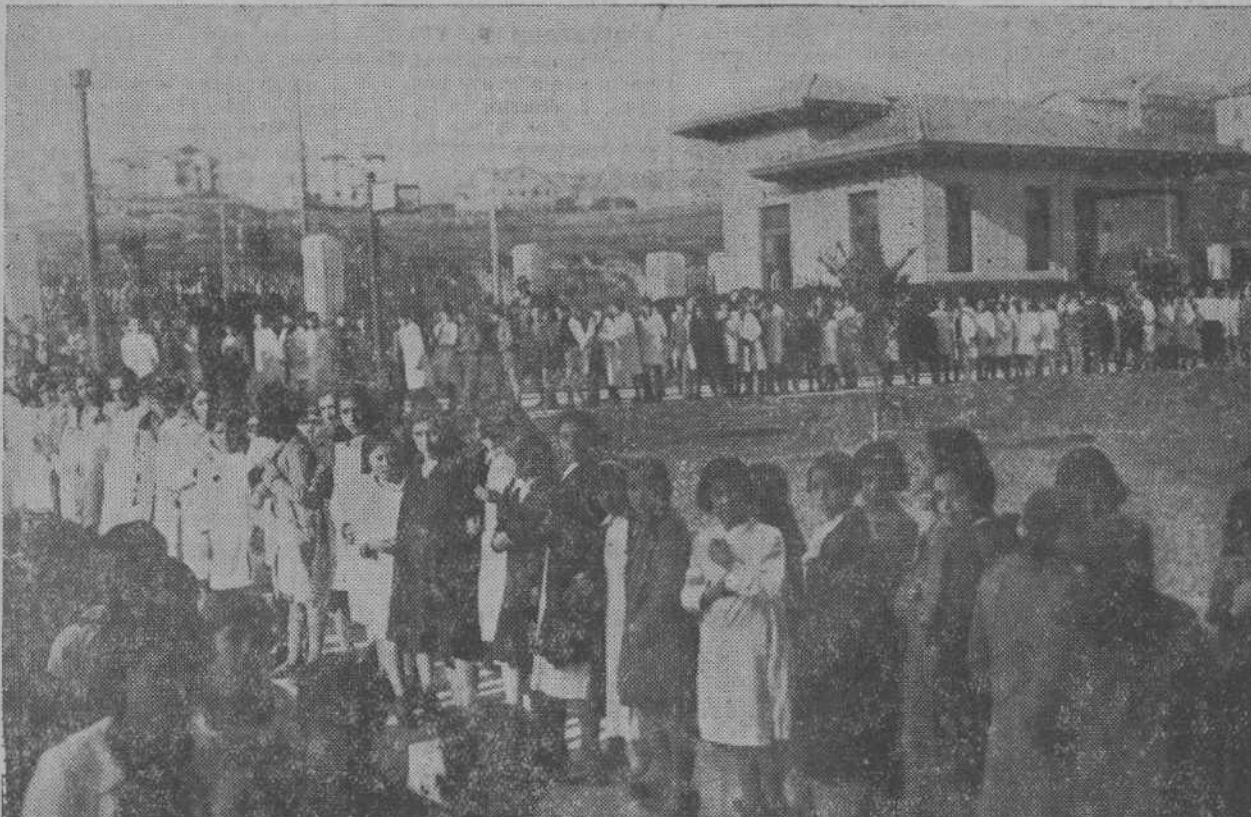
Ante la estatua del marqués de Valdecilla desfilaron ayer, en columna silenciosa y reverente, los pequeños alumnos del Grupo escolar Ramón Pelayo.

CONTINUAN LAS ACTUACIONES JUDICIALES.-MISA SOLEMNE EN LA CATEDRAL.-OFRENDA DE FLORES ANTE EL BUSTO DEL MARQUÉS