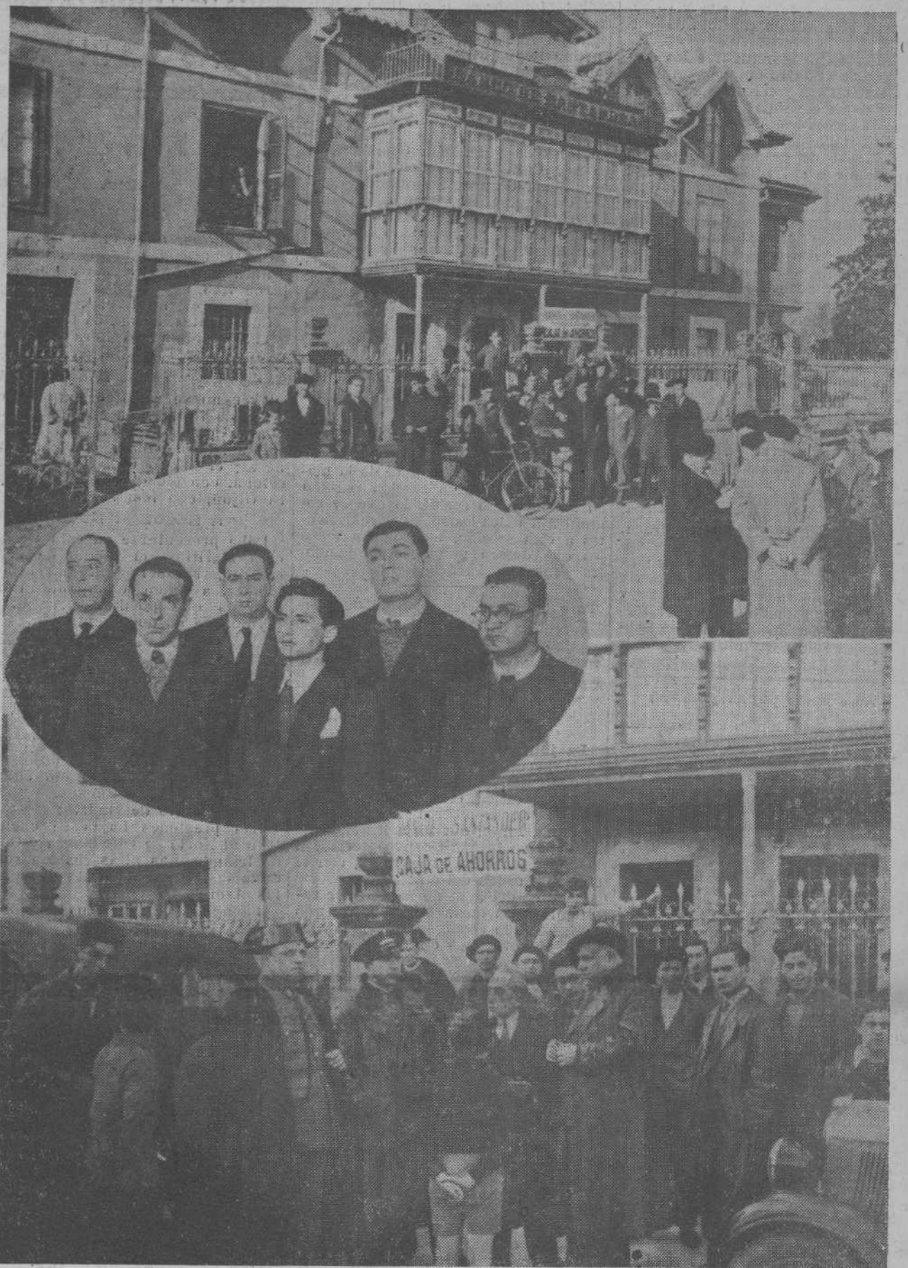
EL ATRACO A LA SUCURSAL DEL BANCO DE SANTANDER EN SARON.—Edificio donde está instalado el Banco que ayer fué atracado.—Nuestros redactores, a poco de cometido el asalto, recogen la información facilitada por varios vecinos y algunos niños que presenciaron la huida de los malhechores.—En el óvalo, el personal de la sucursal asaltada.

REBOLLEDO.—CORONAS DE FLORES.—TELEFONOS 17-30 Y 25-53