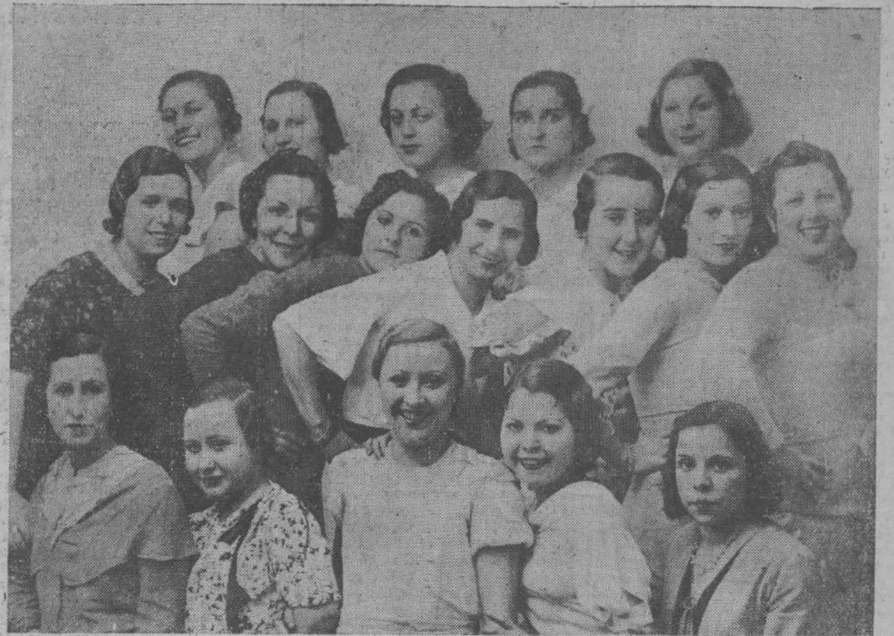
Bellas y distinguidas señoritas que han de tomar parte en la fiesta benéfica que organiza el Ateneo Popular.

Pompas Fúnebres CEFERINO SAN MARTIN.—Alameda 1.ª, 22.—Teléfono 2064