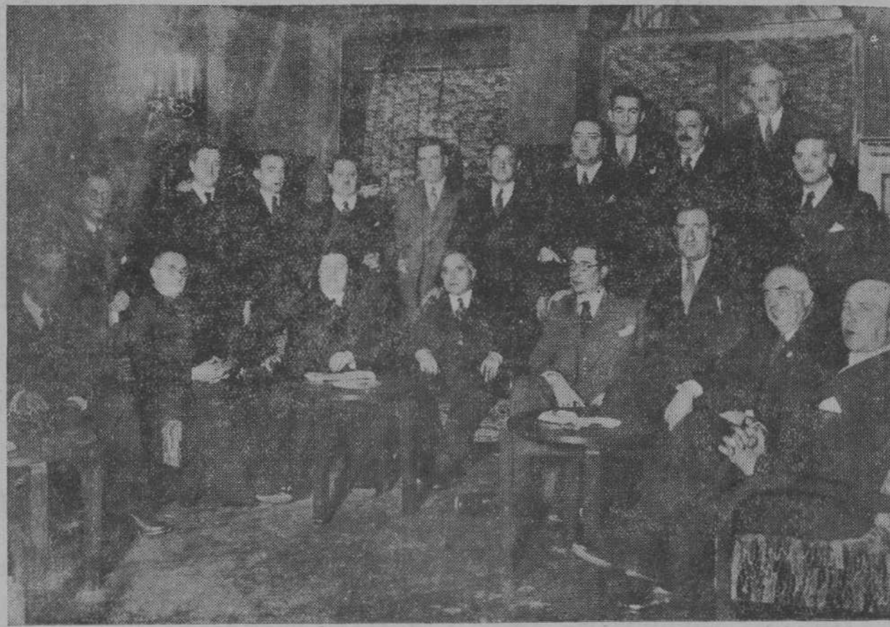
Asistentes al almuerzo ofrecido ayer en el Salón Rojo de Royalty por el Gremio de Vaqueros de Madrid a los ganaderos montañeses y Prensa local.

Por último, se leyó la memoria del presupuesto y se tomó el acuerdo de comenzar la discusión del presupuesto de Gastos el jueves, a las seis de la tarde. Claro que esto no obsta para que ayer empezara la sesión a las siete.